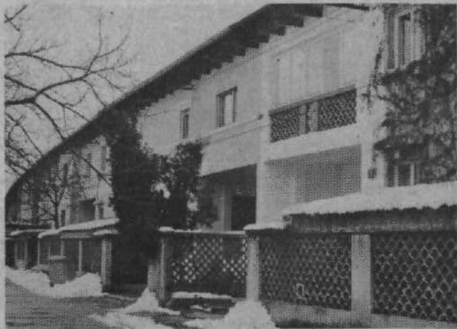
V začetku tridesetih let je Vzajemna zavarovalnica zgradila v Dermotovi ulici prve vrstne hiše za Bežigradom. Stavbe slogovno spominjajo na Plečnika, saj jih je zasnoval njegov učenec arhitekt Tomažič.

Med obema vojnama je Bežigrad doživel pravi razcvet pozidave in postal poligon za preizkus novih gradbenih materialov in stavbarskih oblik. Njegovo rast bi lahko primerjali le z rastjo takratnih severnoameriških mest. V Dermotovi ulici je po zamisli arhitekta Tomažiča Vzajemna zavarovalnica zgradila prve vrstne hiše v