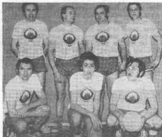
Sportniki KD Slovenija

Posebno pozornost društvo posveča ravno otrokom, ki jim še najbolj manjka znanje materinskega jezika, ki ga na švedskih šolah skozi dopolnilni pouk ne dobijo dovolj. V teh novoustanovljenih skupinah pa se razen petja in plesa naučijo še več materinščine. Nekaj teh otrok je lansko leto letovalo v Po-reču v organizaciji ZPM Šiška, njihovo knjižnico pa je obogatilo 300 knjig, ki so jih darovali učenci šišenskih šol.