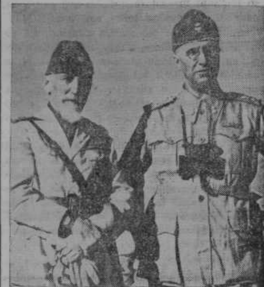
Vrhovni poveljnik italijanskih čet v vzhodni Afriki general de Bono (na levi) in šef njegovega generalnega štaba general Gabba