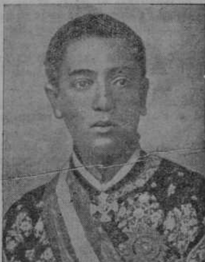
Bivši abesinski cesar, o katerem poročamo pod zaglavjem »Vojna v vzhodni Afriki«.

Sedanji abesinski cesar Haile Selassie se poslužuje vseh srednjeveških in modernih zapornih pripomočkov, da se čuva pred možem, ki je njegov največji strah. Ta mož je Lij Jassou, nekdanji abesinski cesar in nečak velikega cesarja Menelika. Pregnan je bil s prestola s pomočjo Menelikove hčerke, Zaiditu, kateri je pomagal sedajni vladar. Združeno močjo obeh omenjenih je prav: cesarjev naslednik moral v prognanstvo radi duševne manjvrednosti.