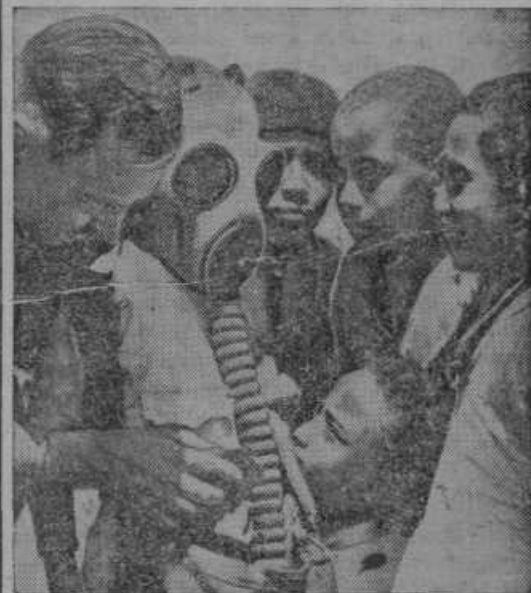
Abesinske otroke vežbajo v uporabi plinskih mask.

Kljub vojnemu stanju še do danes ni prekinila Abesinija z Italijo trgovskih stikov in Italija še vedno uvaža na strogo abesinsko ozemlje vino in strelivo. Poročevalci inozemskih časopisov trdijo, da je dospela 24. oktobra