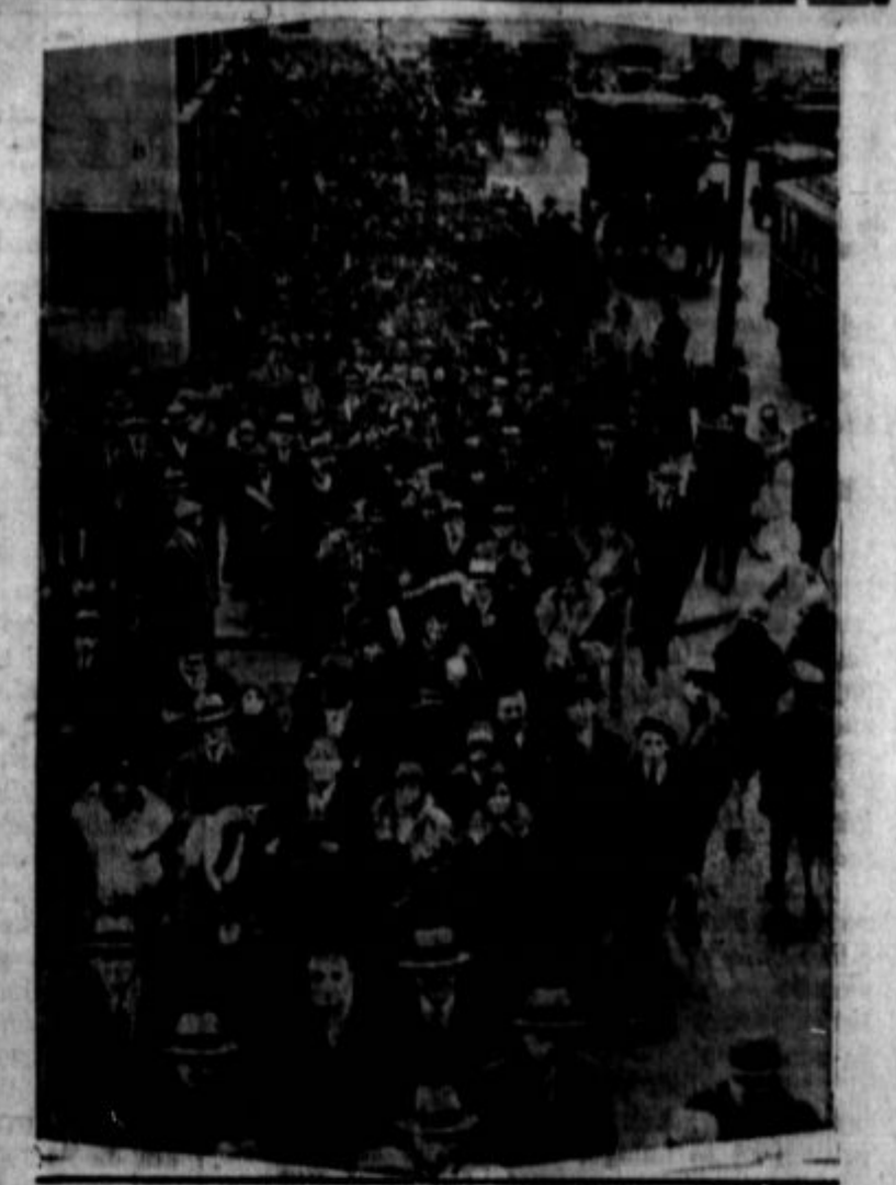
Stavka damskih krojačev v New Yorku. Slika predstavlja stavkarje po doseženem kompromisu z delodajalci.

Washington, D. C. — Šest tisoč železničarjev na India Peninsula železnici je te dni odšlo na stajko, kot se glasí brzogovorno poročilo zveznemu trgovskemu departmentu. Proga te železnice drži v severne pokrajine od mesta Bombaja. Vzrokov, ki so dovedli do stavke, poročilo ne omenja.