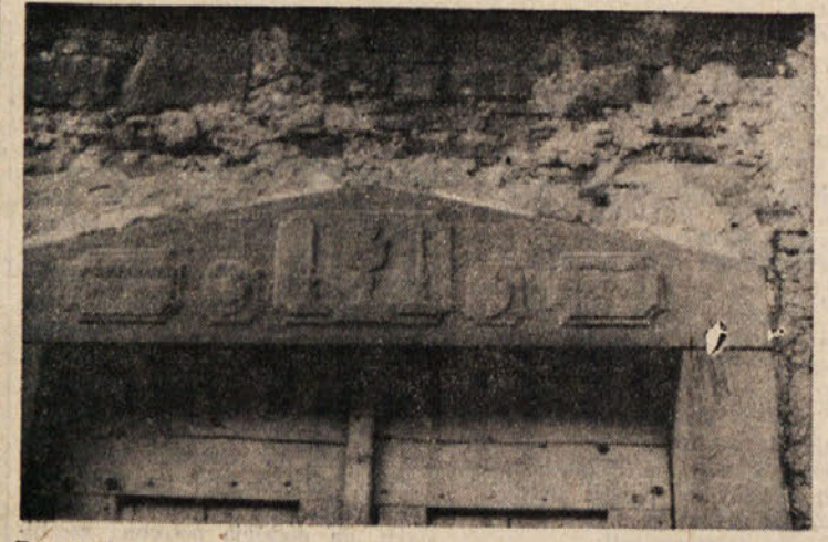
Portal Terezine hiše. Sklesan je bil leta 1902 in izdelal ga je mojster Jože Poropat. (Kakor je mogel bratec sam ugotoviti, sta se pod večerajšnja slika podpisava amojster)

V vasi 6 zidarskih mojstrov in kakih 25 priučenih zidarjev