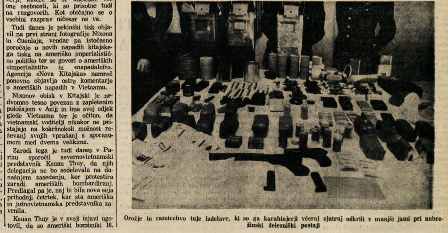
Orožje in razstrelivo tuje izdelave, ki so ga karabinerji včeraj zjutraj odkrili v manjši jami pri nabrežinski železniški postaji