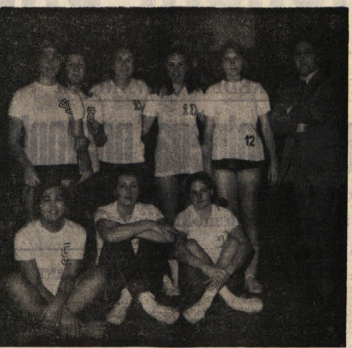
Mlade Sokolove igralke so glavni favoriti za osvojitve naslova pokrajinskih mladinskih odbojcarskih prvakinj