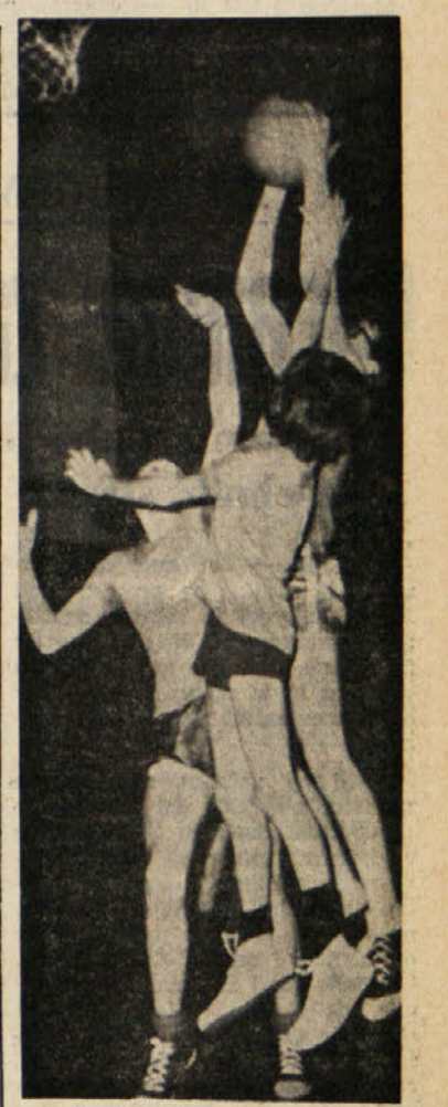
Italsider — Bor: mnogo rok krog ena zoge

RIM, 24. — Sedma kolesarska dirka od Tirenskega do Jadranskega morja bo od 11. do 15. marca. Razdeljena bo na pet etap, ki bodo skupno merile 876 km.