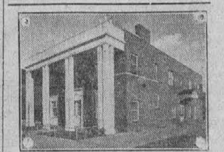
ZAKRAJSEK FUNERAL HOME, Inc. 6016 St. Clair Ave. Telefon: ENDicott 3113