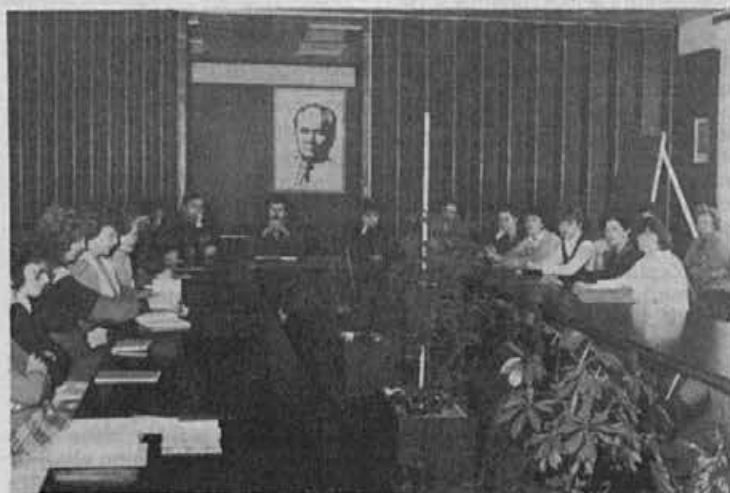
Finančno računovodski delavci se usposablajo

»DELO — ŽIVLJENJE« je glasilo ALPINE, tovarne obutve Žiri, Strojarska ul. 2, n. sol. o., ki ima v svoji sestavi TOZD Proizvodnja, TOZD Prodajo in Delovno skupnost skupnih služb. — Ureja ga uredniški odbor: Marija Albreht, Tatjana Dolenc, Milena Lukančič, Tatjana Mohorič, Helena Kavčič, Marjan Pišljari, Anuška Kavčič — tehnični urednik, Neško Podobnik — glavni in odgovorni urednik. — Izhaja mesečno, naklada 2200 izvodov. Tisk: TK Gorenjski tisk, Kranj