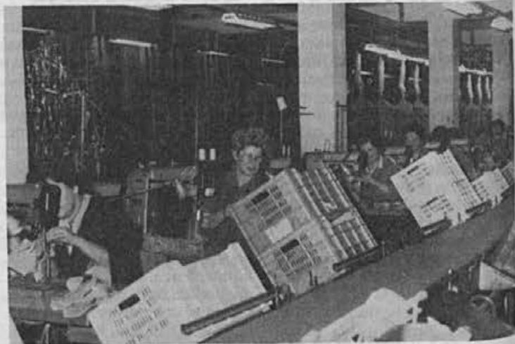
V težki šivalnici se sprašujejo, kdaj bodo urejene odsesevalne naprave

Obeti? »Moram reči, da so slabi. Pred nami je izdelava kolek-