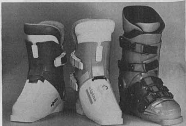
Za izvozno kolekcijo občinska nagrada

— Poslovni partnerji v tujini: uspeh naše prodaje v tujini je veliko odvisen od dobrega dela naših poslovnih partnerjev. Uspeli smo si ustvariti precej stalen krog kupcev, s katerimi sodelujemo dalj časa in imamo ugled solidnega proizvajalca. Glejmo, da ne bomo tega ugleda zapravljali. Na drugi strani pa bomo morali v primerih, kjer posamezni kupci ne ustrezajo zahtevnosti na-