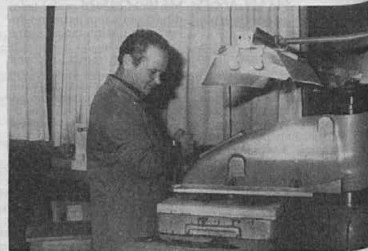
Pri naravnih materialih je potrebno več znanja in pozornosti