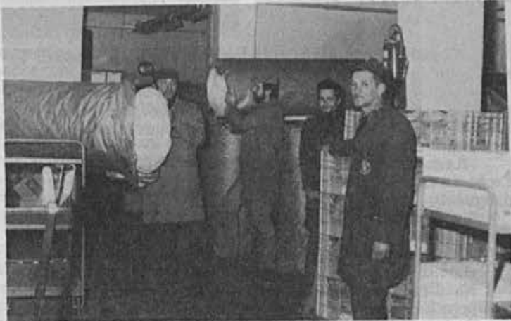
Poslovno leto zaključujemo z dokaj sprotnimi dobavami materiala

»Toda že septembra so nam obljubili, da bodo odsesevalne