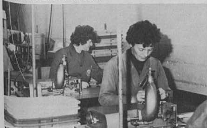
Kvaliteta je pogoj za dober izvoz