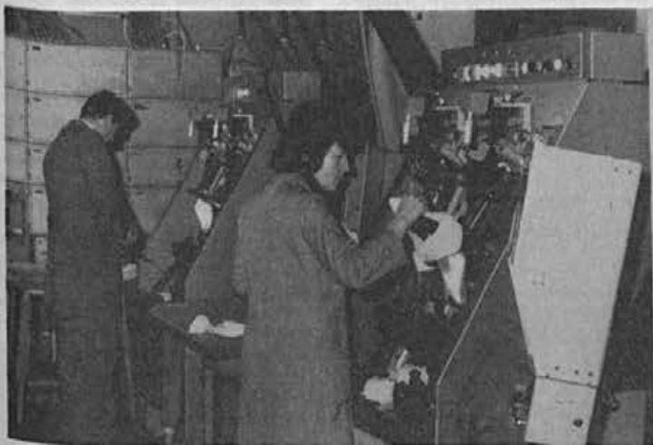
Stroji so v redu, le sestavni deli niso vedno najboljše pripravljani