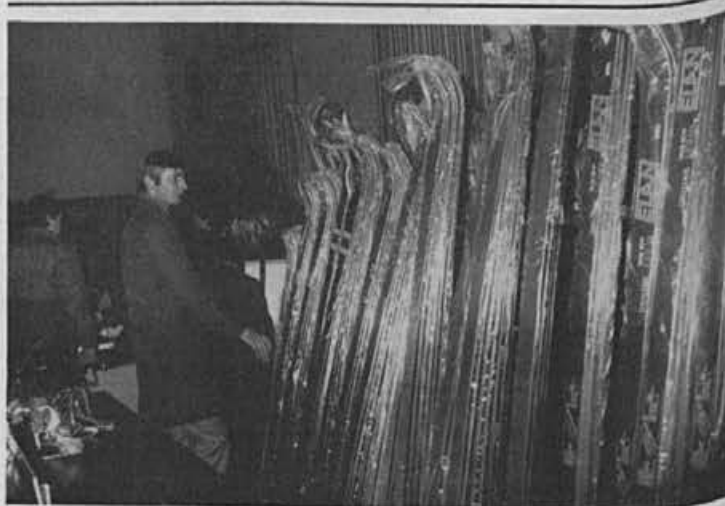
Sejem — priložnost za dober nakup