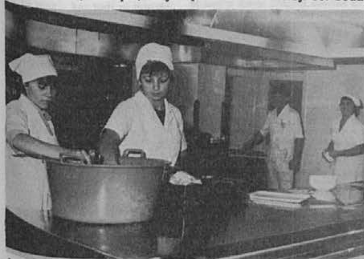
Izgleda, da bo malica zelo okusna

Na koncu še zanimivost: osnovan bo svet delavcev, ki se bo sestajal vsak mesec in ki bo lahko vplival na delo kuhinje. In da ne pozabim: z osebnimi dohodki niso najbolj zadovoljni: »Toda vsako delo je po svoje zahtevno«, pravijo, in delajo naprej.