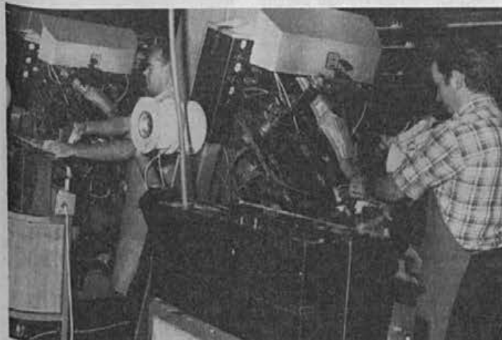
Stroja za cvikanje konic sta zelo dobrodošla