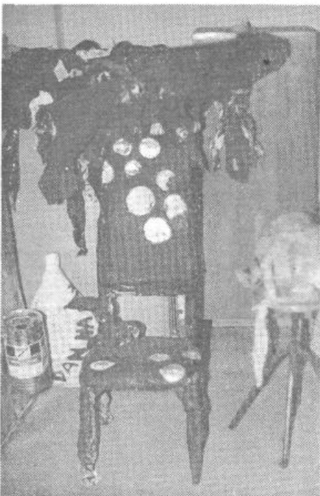
Prestol narejen iz odpadkov