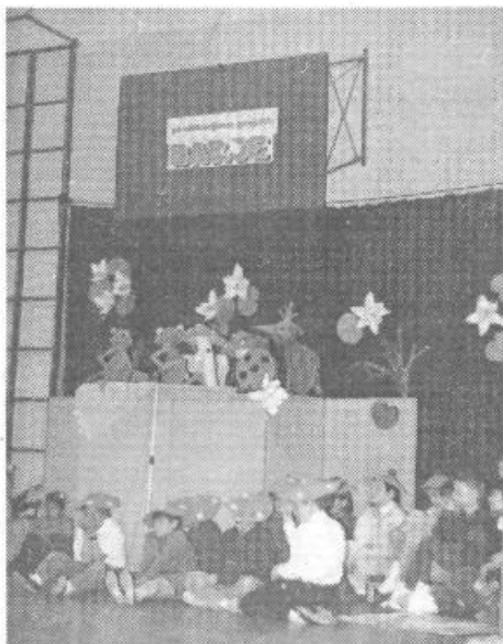
V šolski telovadnici so učenci razredne stopnje na osrednji prireditvi prikazali tudi nekaj igrice in plesov

Učenci predmetne stopnje, to je od 5. do 8. razreda (ti