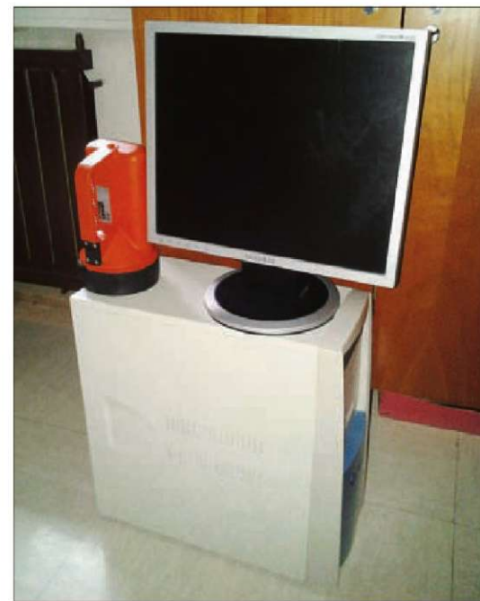
Ali ga kdo pogreša?