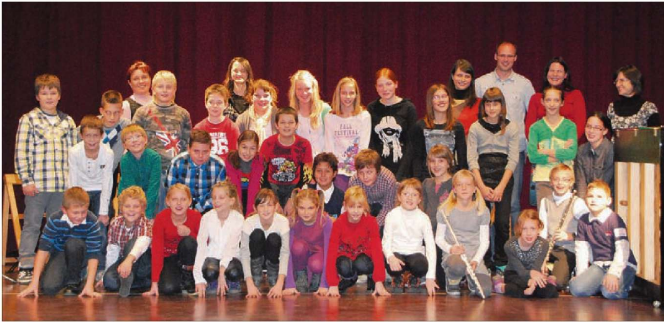
Vojniški glasbeniki z mentorji