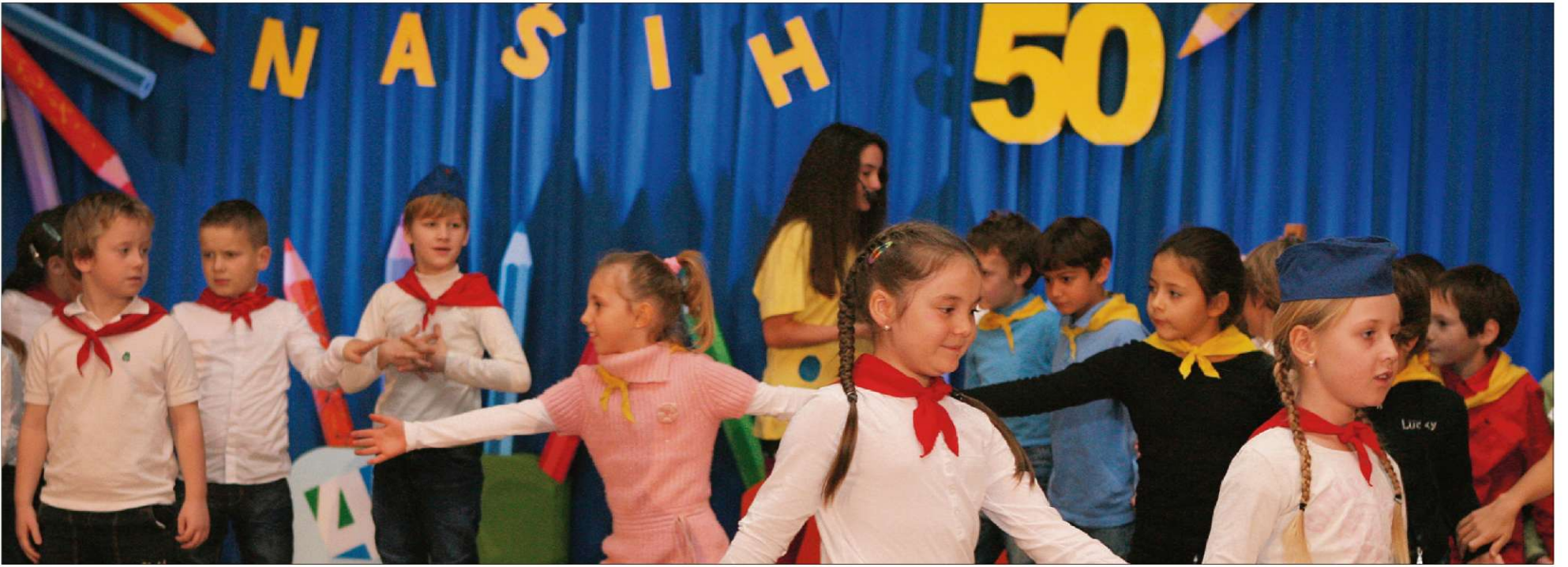
Osrednja slovesnost ob 50-letnici IV. OŠ Celje, ki so jo pripravili v četrtek, je bila zasnovana kot zgodovinski preplet minulih desetletij, zato so v šoli poiskali tudi pionirske kapice in rutice.