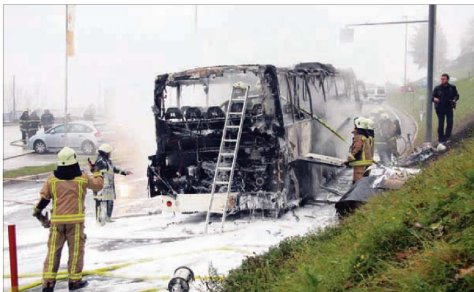
Od avtobusa je v požaru ostalo bore malo.

»Uporabnikom odsvetujemo obisk kakršnekoli spletne strani, h kateri pozivajo neznan pošiljatelj (naj gre za domače ali mednarodne številke). Svetujemo še, da uporabniki taka sporočila takoj izbrišejo ter o tem obvestijo svojega operaterja. V kolikor se uporabniki nevede ali nehotе prijavijo v SMS-klub, jim priporočamo, da za odjavo prejemanja komercialnih sporočil pošljejo ključni besedi ODJAVA ali STOP na številko, s katere prejema sporočila. Za pomoč se lahko obrnejo na ponudnika storitev ali se od komercialnih sporočil odjavijo na podlagi navodil, ki jih najdejo na spletnih straneh ponudnika,« opozarjajo na Si.mobilu.