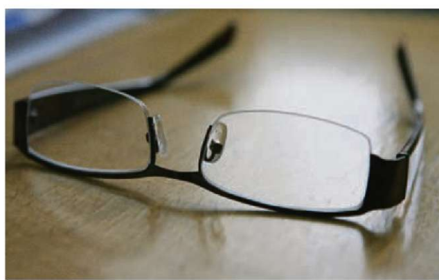
Določena korekcijska očala lahko kupite na račun zdravstvenega zavarovanja.

ZPS je 186 optik iz vse države, pogodbenih dobavitelj ZZZS, pozvala, naj ji posredujejo podatek o ponudbi okvirjev, ki jih lahko potrošniki brez doplačila dobijo na recept. Odgovorila je manj kot polovica optik, se je pa pri tistih, ki so informacijo posredovale, ponudba v primerjavi z letom 2010 povečala. ZPS je informacije objavila na svoji spletni strani, kjer je mogoče natančno videti, koliko brezplačnih okvirjev ponuja katera optika. Kot se je izkazalo, je ponudba zelo različna. Med ponujenimi otroškimi okvirji v posamezni optiki se število giblje med ena in sto, med okvir-