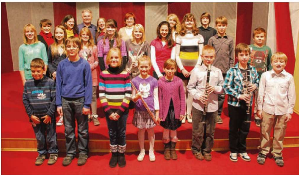
Mladi štorski glasbeniki z mentorji