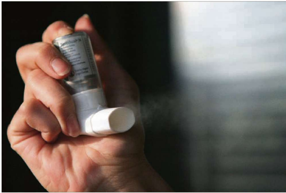
Brez inhalatorja nikamor. To je namreč najpogostejša naprava, s katero si bolniki z astmo v pljuča vnesejo zdravilo. Obstaja sicer veliko vrst inhalatorjev.