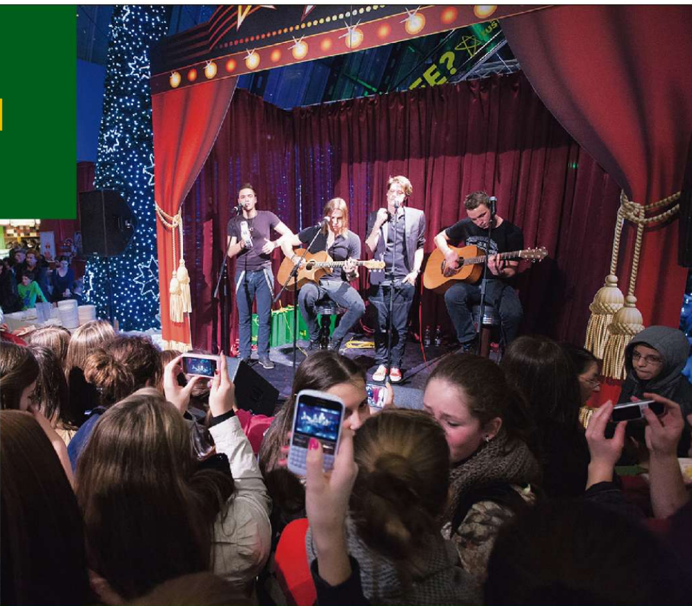
Praznovanje desetega rojstnega dne Planeta Tuš Celje, osrednjega zabavnega in nakupovalnega središča v regiji, so zaokrožili s koncertom najbolj vroče najstniške skupine ta hip – In&Out.