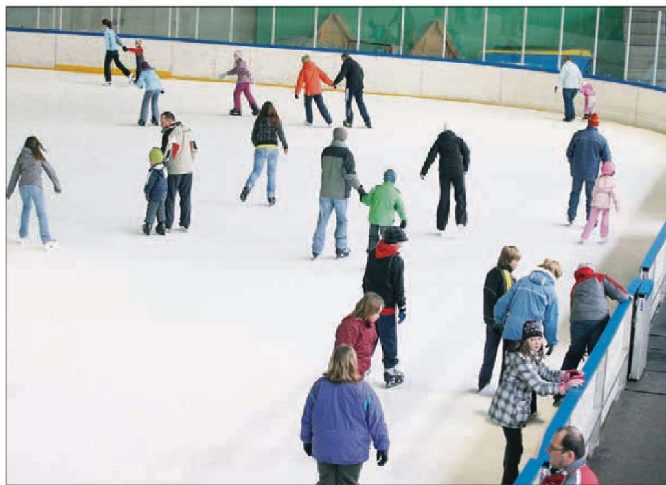
Utrinek z drsališča v celjskem mestnem parku.