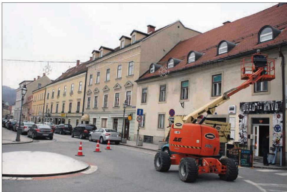
Te dni v središču Celja nameščajo lučke praznične razsvetljave, ki bodo tudi letos razsvetlile mesto na Miklavžev večer.

V Rogaški Slatini bo letos skupaj okrašenih več kot sedem kilometrov cest, ulic, sprehajalnih poti in trgov. Občina bo do četrta namestila 368 elementov novoletne razsvetljave, med njimi 181 svetlobnih okraskov in 3.800 metrov svetlobnih verig. Kot navaja Čuješ, bo okrasitev razveseljevala tako sprehajalce po mestu kot tiste, ki se le peljejo skozi mesto. Ob cestah bodo nameščeni številni svetlobni okraski, vodomete v križiščih bodo zamenjali raznoliki svetlobni vrelci in drugi motivi, na promenadi, ki je najdaljše sprehajališče v mestu, bodo zasvetili ledeni šopki, okrašeni pa bodo tudi občinska stavba, kulturni center in Anin dvor. Čuješ ob tem poudarja, da poleg občine za prijetno decembrsko vzdušje z okraševanjem poskrbi tudi turistično gospodarstvo, ki okraši hotele, za ves mesec pa različni organizatorji pripravljajo tudi pestro prireditveno dogajanje.