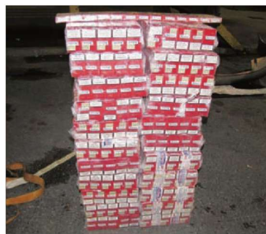
Tole sta Romuna stlačila v prirejeno dno vozila.