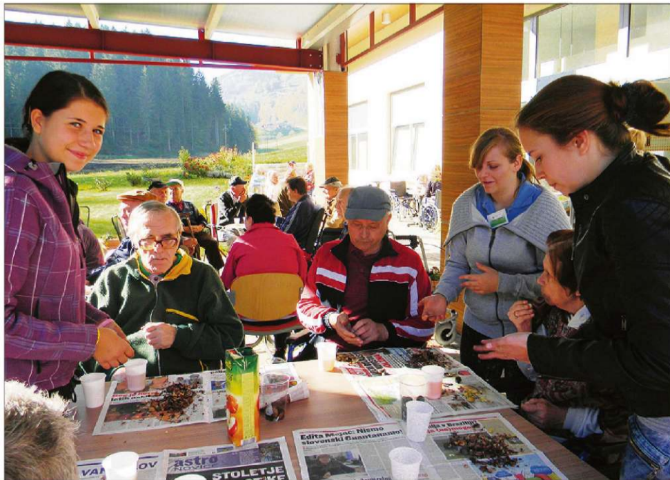
Diakinije iz Avstrije so se veliko družile in pogovarjale s stanovalci PV Zimzelen.