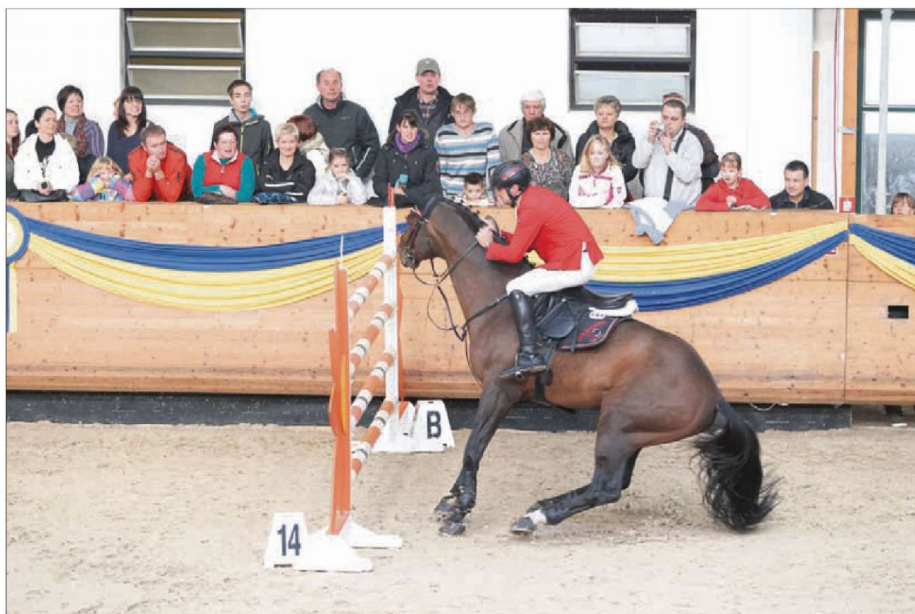
Nekateri ne skačejo na ukaz.