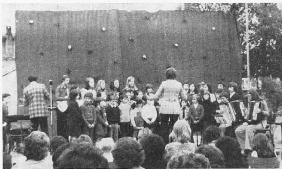
Zbor »Slovenski šopek« iz Mačkolj na letošnjem prvomajskem slavlju v Bazovici

Slovenska glasbena šola v Trstu priredi v četrtek 23. maja v Kulturnem domu let-