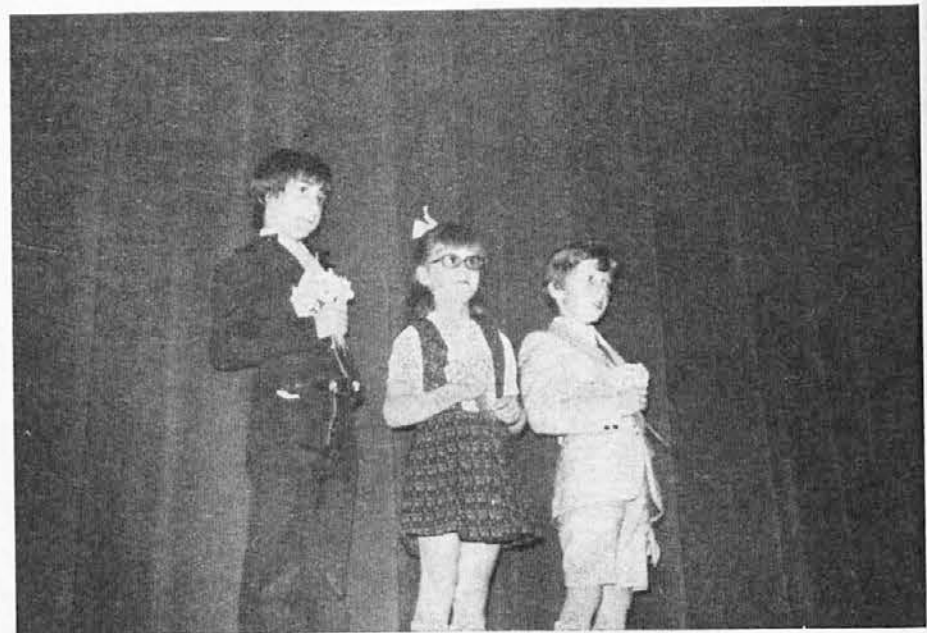
To nedeljo bo v Doberdobu popoldne ob 4. uri v župnijski dvorani v počastitev mater mladinska glasbena akademija, na katero ste vsi vrolo vabljeni, posebej pa še starši prvoobhajancev in otrok, ki obiskujejo glasbeno šolo. - Na sliki prizor z lanske počastitve naših mamic v Doberdobu.

V Zgoniku bo v četrtek 23. maja ob 11. uri sv. birma. Zvečer ob 20. uri slovesne šmarnice, nato na dvorišču Mollérova komedija »Zdravniki po silo«, ki jo bo uprizorila dramska skupina PD »Standrež«.