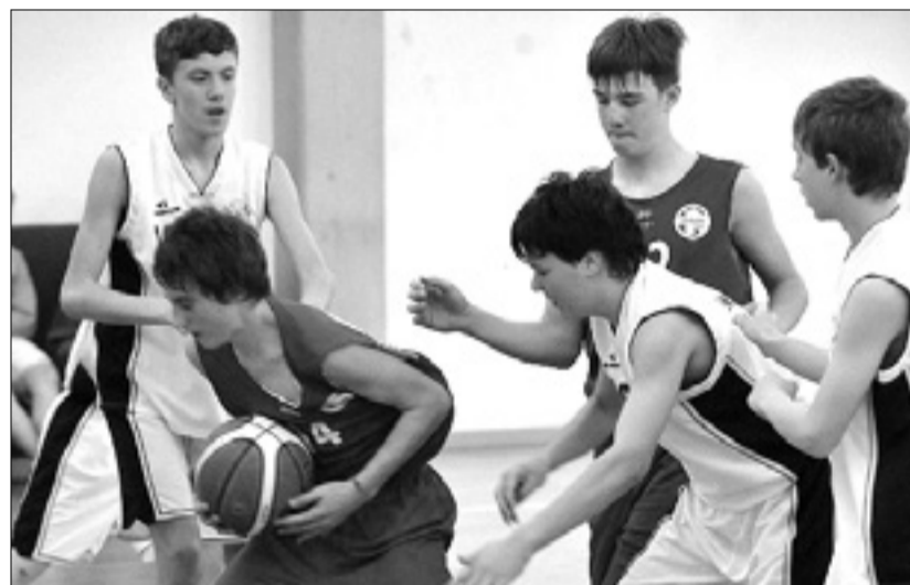
Slovenski derbi v Dolini