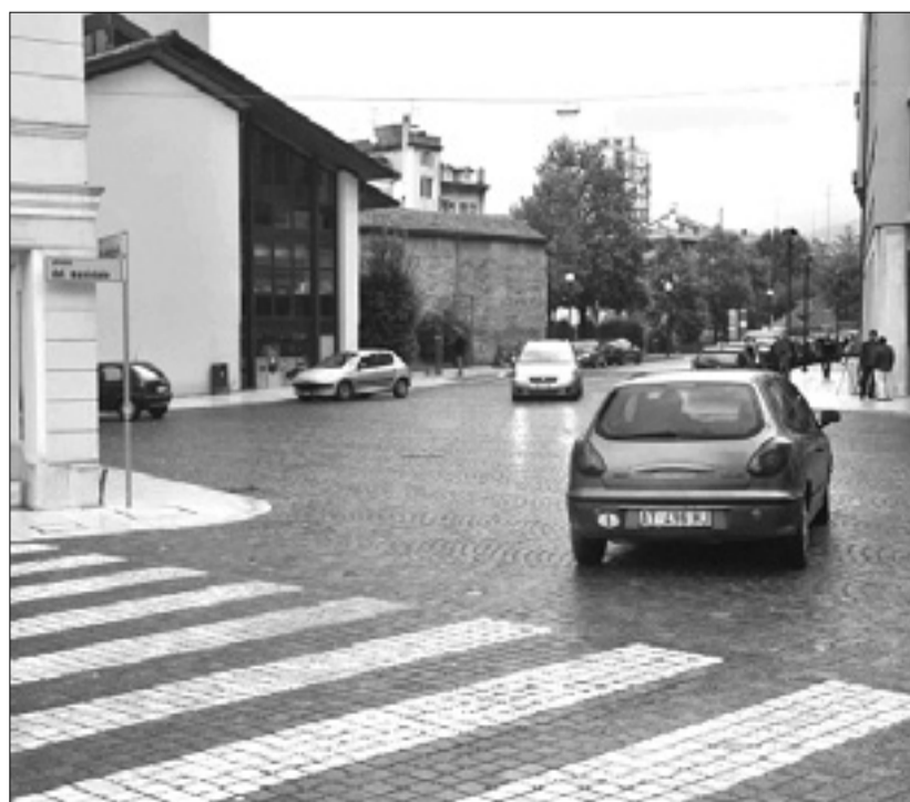
V Ulici De Gasperi in na trgu pred županstvom ni več pregrad, ki bi ovirale promet

Družba Irisacqua je napovedala, da bo prihodnji teden začela z deli v Ulici Duca D'Aosta