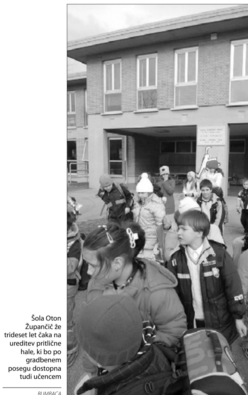
Šola Oton Župančič že trideset let čaka na ureditev pritlične hale, ki bo po gradbenem posegu dostopna tudi učencem

»V projektu je predvidena tudi obnova že obstoječih stranišč v pritličju in