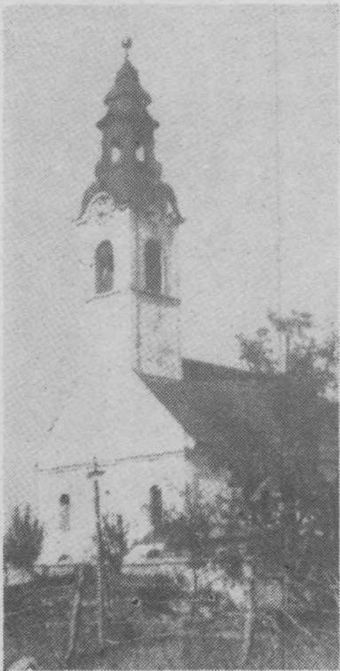
Urh – spomenik in živ spomin na številne žrtve je danes eden najbolj obiskanih spomenikov našega mesta.