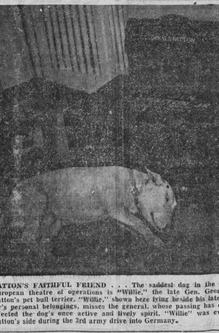
PATTON'S FAITHFUL FRIEND... The saddest dog in the entire European theatre of operations is "Willie," the late Gen. George S. Patton's pet bull terrier. "Willie," shown here lying beside his late master's personal belongings, misses the general, whose passing has deeply affected the dog's once active and lively spirit. "Willie" was ever at Patton's side during the 3rd army drive into Germany.