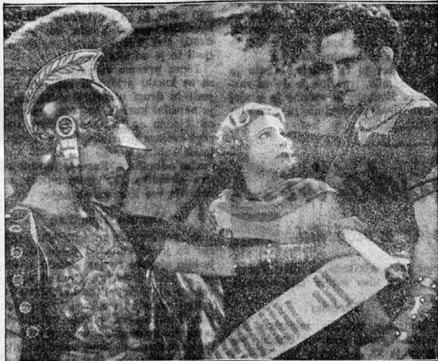
Tigellinus, Mareus Superbus in Marcia v filmu »V znamenju križa«

Stara rimska republika je bila vzor preprostosti, varčevanja in poštenosti, nova republika in Neronovo cesarstvo, s katerim nas seznanja najnovejši Millov film »V znamenju križa«, pa utelešena nadutost, razsipnost in laž. Neka majhna četica izbrancev je imela oblast in denar. Oni so vladali po mili volji. Naročali so si orožje, najemali vojake, samo da so zmogli vsak najmanjši odpor. Vse težnje, želje in zahteve po reformaciji so jim bile odvratne. Tiberij in Gaj Grakh, dva mlada moža iz odličnih rimskih družin, sta