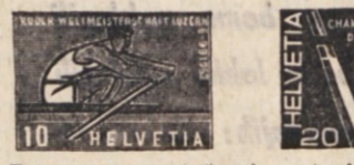
Prvi na neznanji šport, metanje kama, je bil celo olimpijski pano-ga (levo); svetovno hokejsko prvenstvo leta 1961 (v sredini); sve-tovno veslaško prvenstvo v Lucernu leta 1962 (desno)