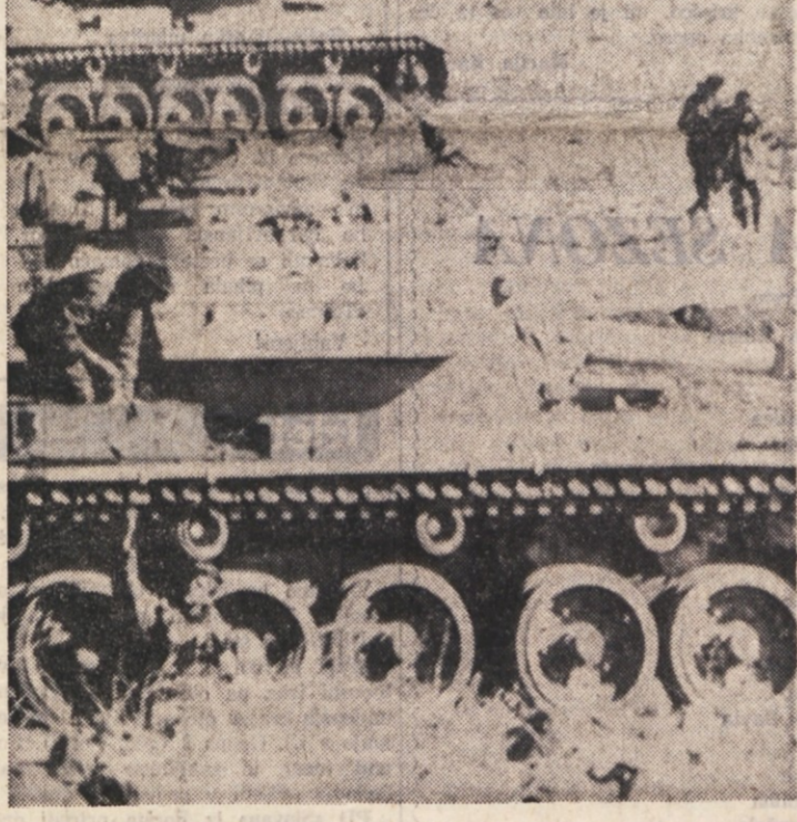
Izraelci na Golanskih višavah neposredno pred začetkom večerajšnjega spopada