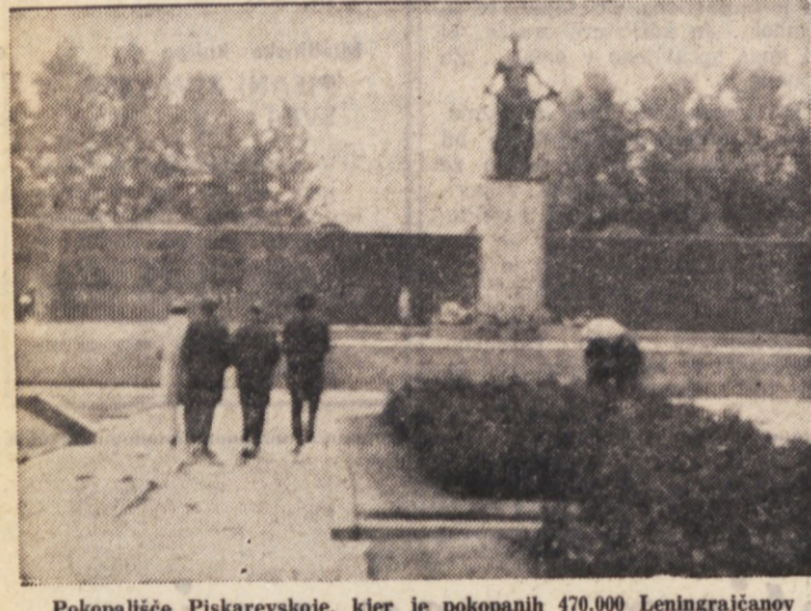
Pokopališče Piskarevskeje, kjer je pokopanih 470.000 Leningračanov