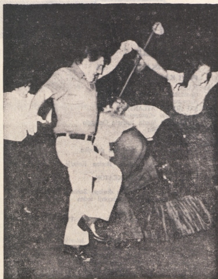
Prizor iz »Češnjjevega vrta«, posnet med vajo

»Pišiš dalje!« Mnogo ljudi se trudi, da bi si uredilo skromno in mirno žitlje. Tudi mladi ljudje skušajo pomagati svojim staršem, da bi jim bilo žitljenje lažje in srečnejše... »Koliko pa je ura?«, me nena doma hlasno vpraša.