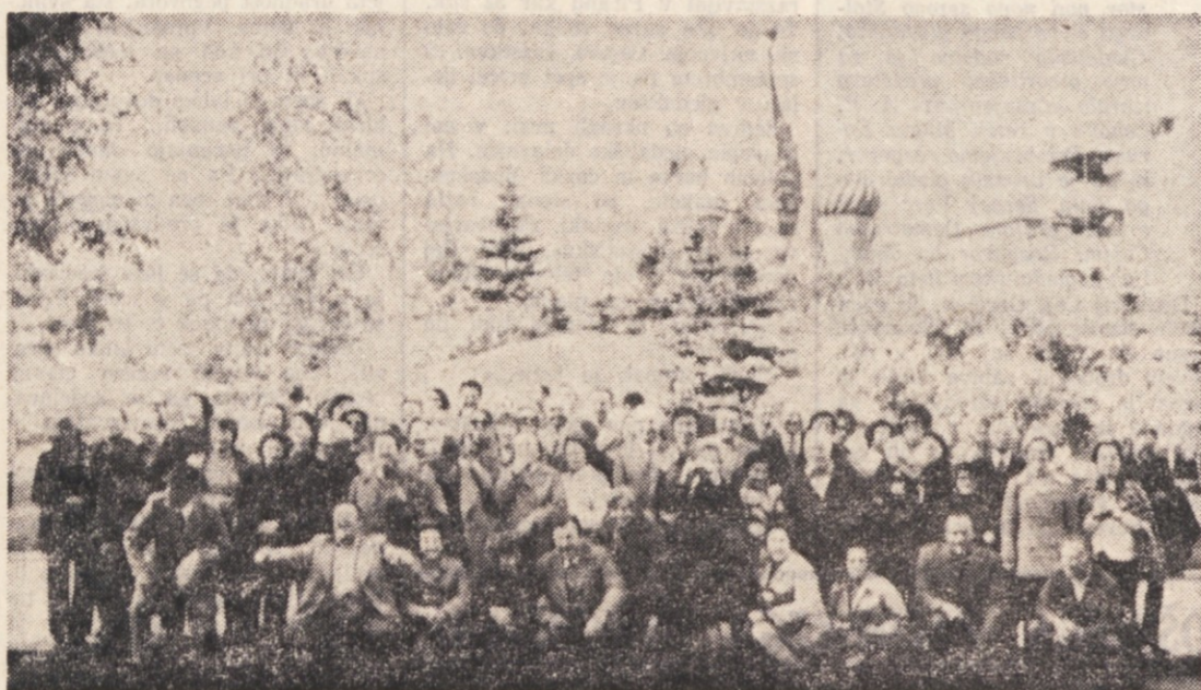
Skupinska slika izletnikov v Moskvi nasproti hotelu Rossia, v katerem smo stanovali tri dni