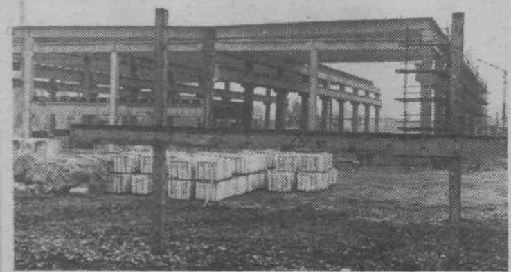
Gradbišče nove Gradisove tovarne gradbene opreme in strojev v industrijski coni MP — 3

Tovarno bodo gradili po fazah. V prvi fazi bo zgrajenih 12.500 kvadratnih metrov proizvodnih površin.