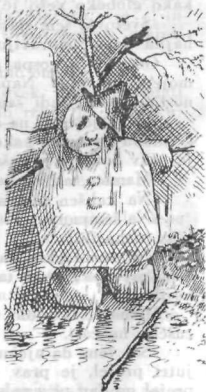
Pot mu z lica lije ...