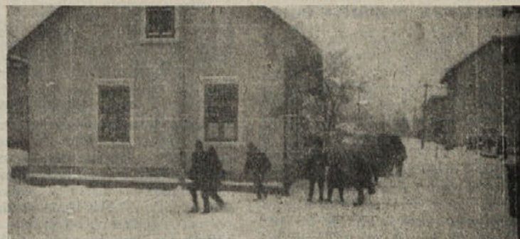
»Vlakarji« na poti v šolo — zadnjič v polletju

Z novim letom je ribniška kmetijska zadruga oddala trgovino Železnina trgovskemu podjetju Jelka. Zadruga pa bo še naprej obdržala preskrbo kmetovalcev s krmili, gnojili in drugim reprodukcijskim in investicijskim materialom. To je potrebno zaradi uspešnejšega razvoja kooperacije, ker bo te artikule kmetom lahko ugodneje nudila.