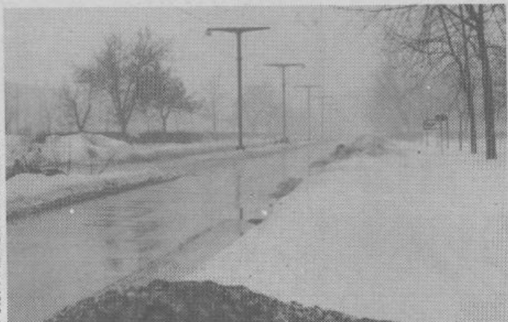
Kdor se peš odpravi vzdolž Djakovičeve ulice, mora imeti srečo, saj so pločniki varno skriti pod snegom. Gorje mu, če naleti na avtobus ali tovornjak.