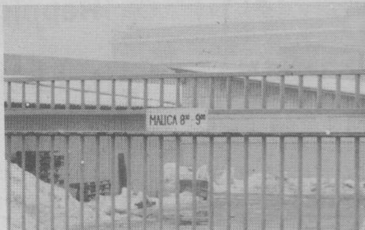
Tudi tako se uveljavljajo delavske pravice