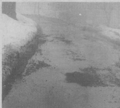
Odjuga nam je prinesla že prve udarne jame na cestah