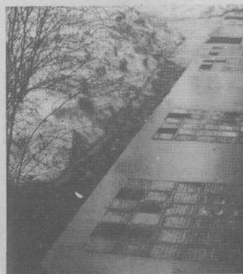
... nič manjša nevarnost pa ne preži tudi na pločniku, saj vse več ploščic manjka!