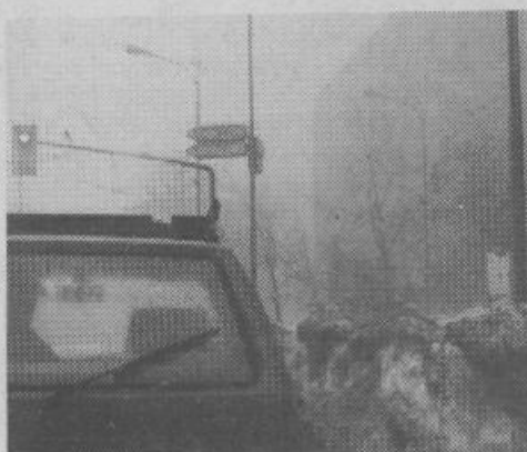
Navkljub vsem naporom komunalcev pa visoki kupi snega v križiščih še vedno slabijo prometno varnost