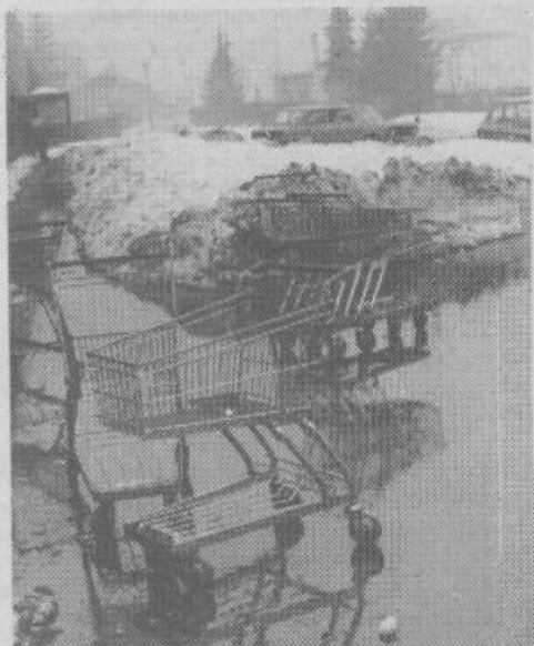
Nakupovalni vozički kljubujejo zimskim nevarnostim