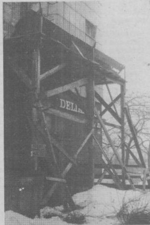
Na jami je vse po starem (plošče še naprej padajo)...