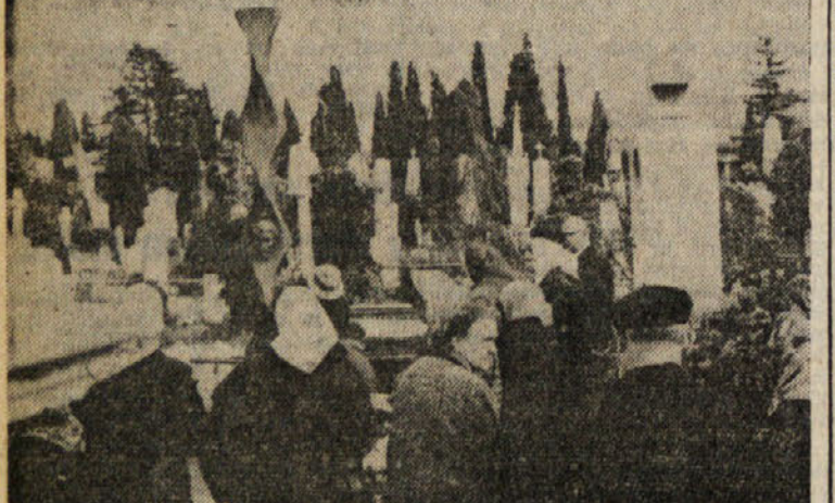
Delegacija SKGZ polaga vence na grob bazoviških junakov pri Sv. Ani