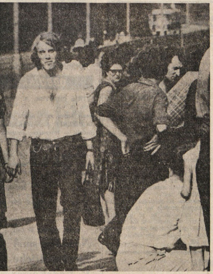
Ne le v Londonu, Parizu, Rimu in drugih zahodnih prestolnicah in velikih mestih, pač pa se «dolgotasi mladeniči vedno v večjem številu pojavljajo tudi v velikih mestih vzhodne Evrope. Največ jih srečujemo po mestnih ulicah Prage, od koder je tudi gornja slika «dolgogasega mladeniča, ki si svoje «kodre» kod barva.