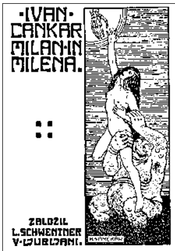
Naslovna stran ljubezenske pravljice Milan in Milena (1913) Ivana Cankarja z ilustracijo Hinka Smrekarja.

naskrivaj pomežiknile zvezde v njem. Ko sta se srečala na dnu, sta se poljubila ter se nasmehnili drug drugemu tako ljubezni polno, kakor da sta si bila brat in sestra že v samem večnem Bogu.« 56