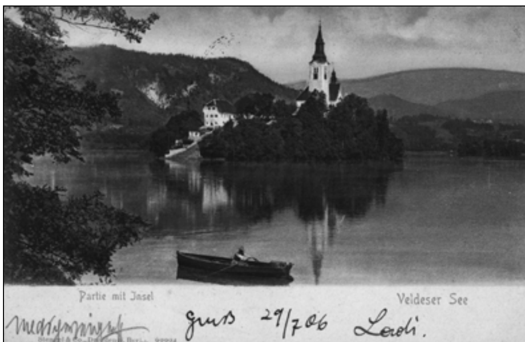
Blejska razglednica z motivom otoka, poslana leta 1906 (iz zasebne zbirke Leopolda Kolmana).

V pesmi je opazen političen poziv narodu, naj se upre tujim gospodarjem in postane sam svoj gospodar.