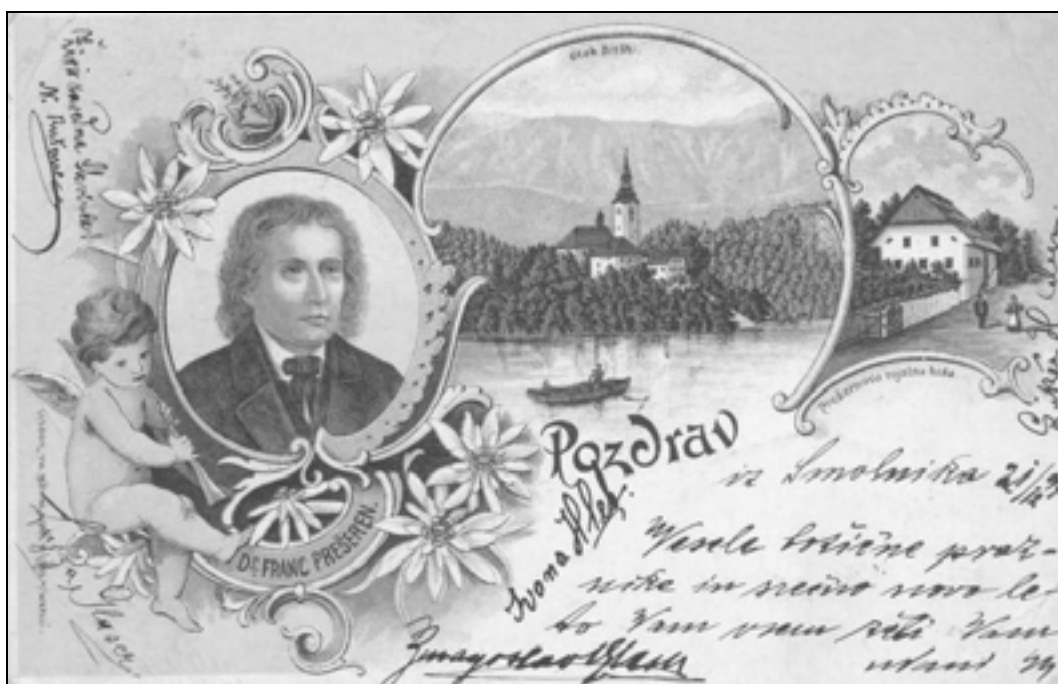
Blejska razglednica z motivom Franceta Prešerna iz 19. stoletja.

Povedat' moram ti, da sem kristjana, malikov zapustila vero krivo, da je bežala ta k' ob solncu slana, da dal krstit' je oča glavo svojo, soseska je, Marije službi vdana, v dnu jezera utopila bóg'njo Živo. 40