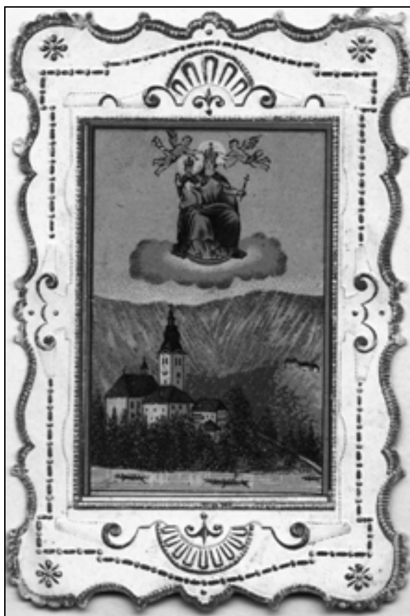
Božja podobica Bleda iz 19. stoletja (iz zasebne zbirke Leopolda Kolmana).

povezuje otoško cerkvijo z otokom kot Marijinim bivališčem, z zvončkom želja, ki prenese prošnje vernikov v Marijino naročje, da jih lahko usliši, z ljudsko vero v Marijo, s poganskim češčenjem boginje Žive ... Marija je v pesmih in proznih delih poimenovana različno: Devica Marija, Mati Božja, Kraljica slovenskih src, Kraljica, »presvitla« Matera, Porodnica, Davidinja, jezerska Mati, Bogorodica, Madona ... Ta motiv češčenja Marije poveže tudi z narodno zavestjo.