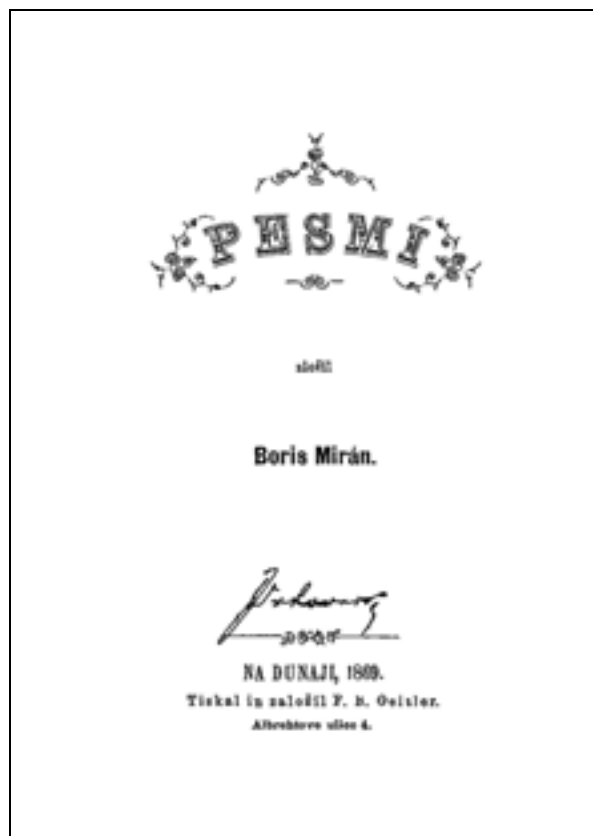
Naslovnica Stritarjeve pesniške zbirke Pesmi (1869), v kateri je objavil tudi pesem Bog sprimi svetlo te jezero .

Josip Stritar je svoja dela o Bledu povezal z nesrečno ljubeznijo. Leta 1868 je po dolgem času obiskal domovino, po teh vtisih je nastal drugi cikel Popotnih pesmi, med njimi tudi pesem Bog sprimi svetlo te jezero (1869), ki jo je postavil na Bled. 51 Pesem je desetkitična, v njej lirski subjekt izpoveduje svoje razpoloženje. Poje hvalnico Blejskemu jezeru, saj je hrepenel po njem: hotel ga je še enkrat videti. Toda ni več tako, kot je bilo v mladostnih časih, ne sklada se več s subjektovo notranjostjo – preveč grenkobe in trpljenja v življenju je spoznal. Poistoveti se z labodom, ki verjetno prav tako kot on sam išče izgubljen ljubezen. Tolažbo najde v pesmi, kajti ko jo bo ona prebrala, se ji bo v očesu utrnila solza. Stritarjevo delo Zorin (1870) se dogaja v Parizu, zaključí pa se na Bledu – z Milanovo resignacijo nad življenjem in ljubeznijo ter sklenitvijo, da konča življenje v domovini, zato se vrne na Bled. Bled povezuje s Prešernom, oba sta