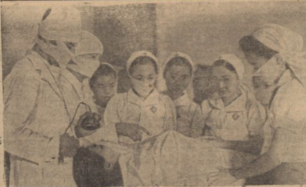
Burmese Mädchen als freiwillige Helfinnen.

Da auch Burma der Terror der anglo-amerikanischen Luftangriffe ausgesetzt ist, ist die Zivilbevölkerung häufig Opfer zu beklagen hat, haben sich burmesische Mädchen zu einem freiwilligen Schwesternverband zusammengeschlossen, um die Pflege der Verletzten zu übernehmen. Unser Bild zeigt die freiwilligen Helfinnen erhalten ihren ersten Unterricht.