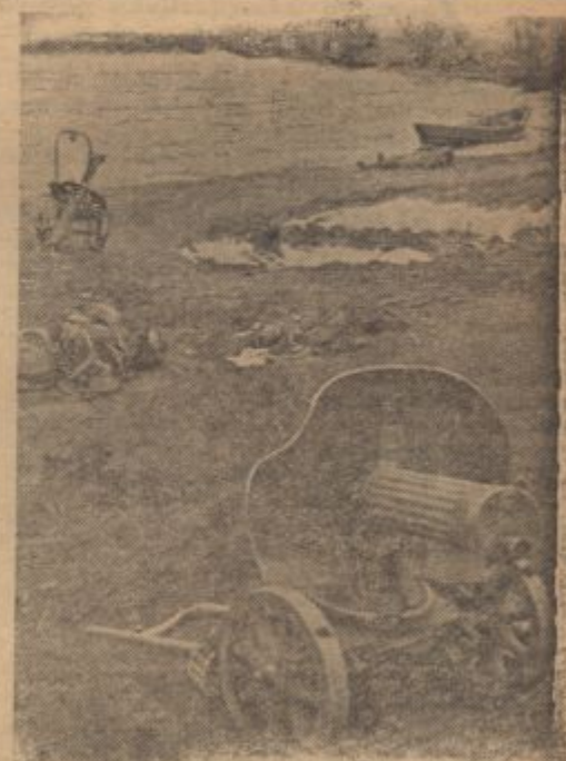
PK-Kriegsbericht Muck (Schl).

Schon kurze Zeit nach dem Absturz des britischen Jagdbombers am Kanal wurde dieser junge Flieger, der sich im Gebüsch versteckt hielt und glaubte, sich der Gefangenschaft entziehen zu können, von unseren Soldaten entdeckt und gefangen genommen.