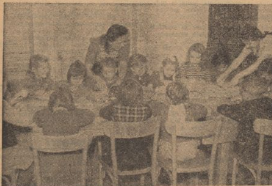
Eichtaler Kinder beim Basteln.

Zahvalno pismo eichtalski Kindergruppi za poslana darila