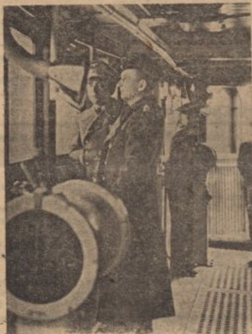
PK-Kriegsb. Meisinger-Scherl (GD).