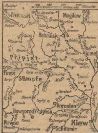
Karte Kampfraum Kiew.)

Iz sobotnega poročila izhaja, da so nemške čete skupno z Romuni zavzele pri Kerču zopet neko vodilno višino. V teku teh operacij so nemške čete preprečile nove sovjetske poizkuse izkrcanja čet v sodelovanju z edinčam. Nemške vojne mornarice in obalni baterijski. 15. zvrhanih čolnov za izkrcanje je bilo pri tem potopljenih. Jugozapadno od Kremenčuga so divjali menjajoči se boji z nezmanjšano srditostjo. Tu je izkubil sovražnik mnogo tankov. Prav tako so se menjavali tudi težki boji v področju Čerkasija, kjer so se vrstili sovjetski napadi in nemški protinapadi. V žitomirskem in korostenskem prostoru so nemške čete nadalje pridobivale na terenu. Med Pripjetom in med Berezino je bilo medtem bele-