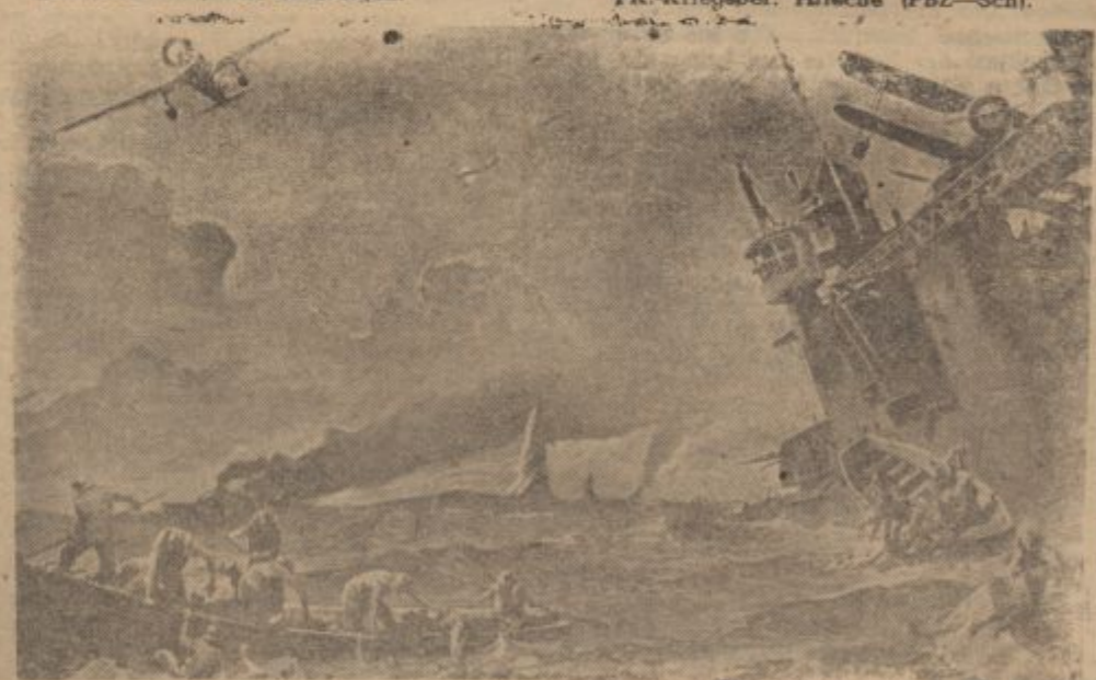
Zu den erfolgreichen Kämpfen der japanischen Marine-Luftwaffe. Diese PK-Zeichnung veranschaulicht die Wirkung eines Angriffes der japanischen Marineluftzeuge auf einen amerikanischen Flugzeugträger. PK-Zeichnung: Baltz-Atl (GD).

ten. Er spielte vor uns und wir alle waren seine Zuhörer und Gäste, die »stürmisch ihren »Meistern« feierten.