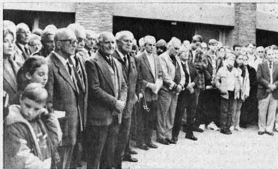
Bivši domobranci in drugi rojaki na spominski proslavi v Slovenski hiši.

LJUBLJANA — Slovenska vojska je povečala svojo letalsko floto. Dobila je nov helikopter bell 206, ki so ga krstili za Petra Klepca. Trenutno ima tri take helikopterje in osem tipa bell 412. Tudi nekaj novih letal bo dobila v teh dneh: dosedanjim trem pilatusom PC-9, trem zlinom 242L in enem utva-75 se bo pridružilo še sedem šolskih letal poljske izdelave: pet lahkih zlinov 242L in dva štirisedežna zlina 143. Ker je še v veljavi mednarodni embargo na uvoz orožja, so letala brez oborožitve. Letalstvo ima v remontu še eno lahko transportno letalo turbolet 410 in še dve utvi-75.