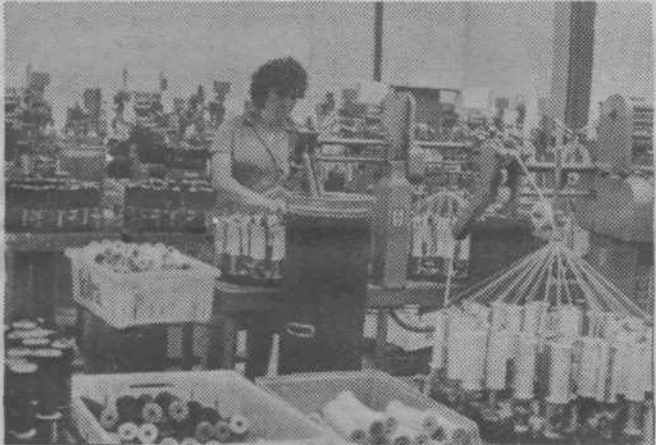
Detalj iz TOZD Pozamenterijskih izdelki — (Foto: Arhiv Totre)

Med pripravami na proslavo naj omenimo športna tekmovanja, ki jih je pripravila komisija za sport in rekreacijo pri OOS Totre. Tekmovale so ekipe delovnih kolektivov KTM, Pletenina, Sava Kranj, milica Moste in se-