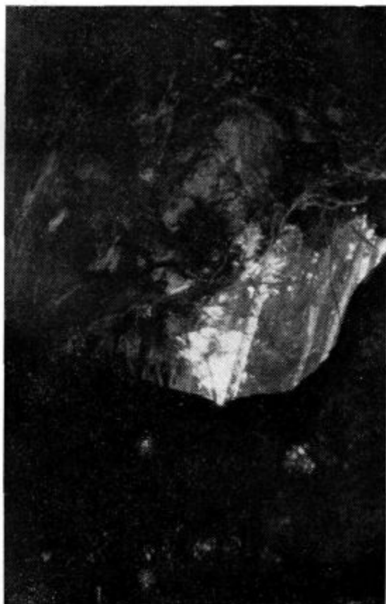
Naravni most pri Tominčevem breznu

Celo leto smo si želeli, da bi se vendarle lotili topografskega merjenja brezna. Res smo se 29. novembra letos pojavili pred vhomom v Tominčevo brezno, otovorjeni s težkimi nahrbtniki in različnim jamskim materialom.