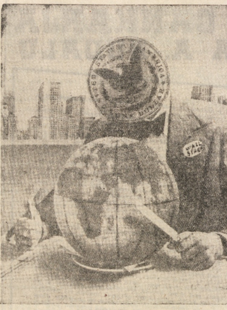
MARSHALLOV PLAN (Literarna Gazeta)