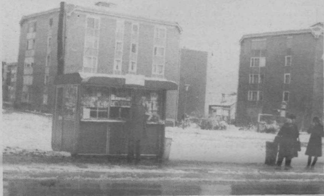
Stanovanjska soseska MS — 6 v Polju ima od spremljajočih objektov le nov kiosk za revije in časopise. Morda bi stanovanjem bolje ustregli če bi prodajali krompir, mleko in kruh. Na prostoru za njim je v načrtu nova trgovina.

tovali gradnjo ob I. referendumu, smo imeli 160 zahtev, sedaj jih imamo že 200; če bo leta 1978 vrtce zgrajen, bo teh zahtev že gotovo 300 ali več. Vrtec je načrtovan za 120 otrok.