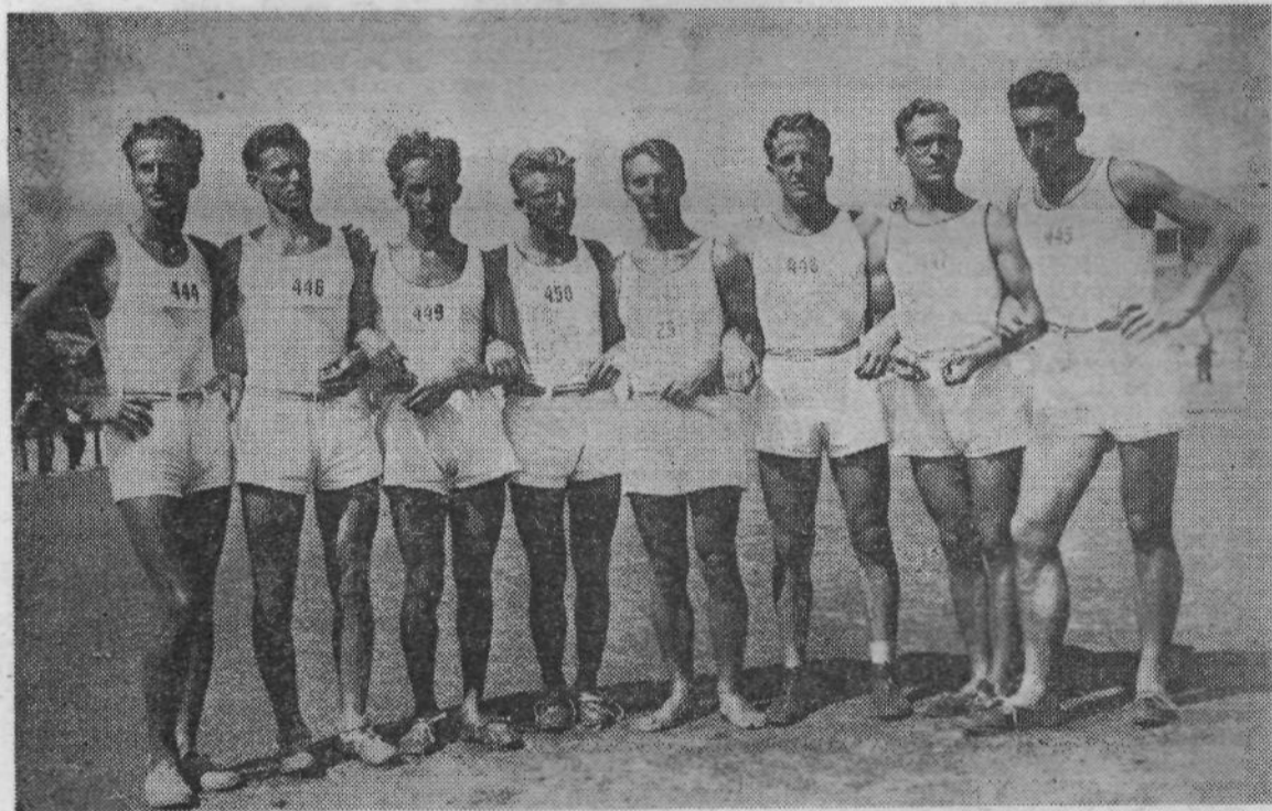
1934: vrsta zmagovalka v peteroboju na zletu v Zagrebu