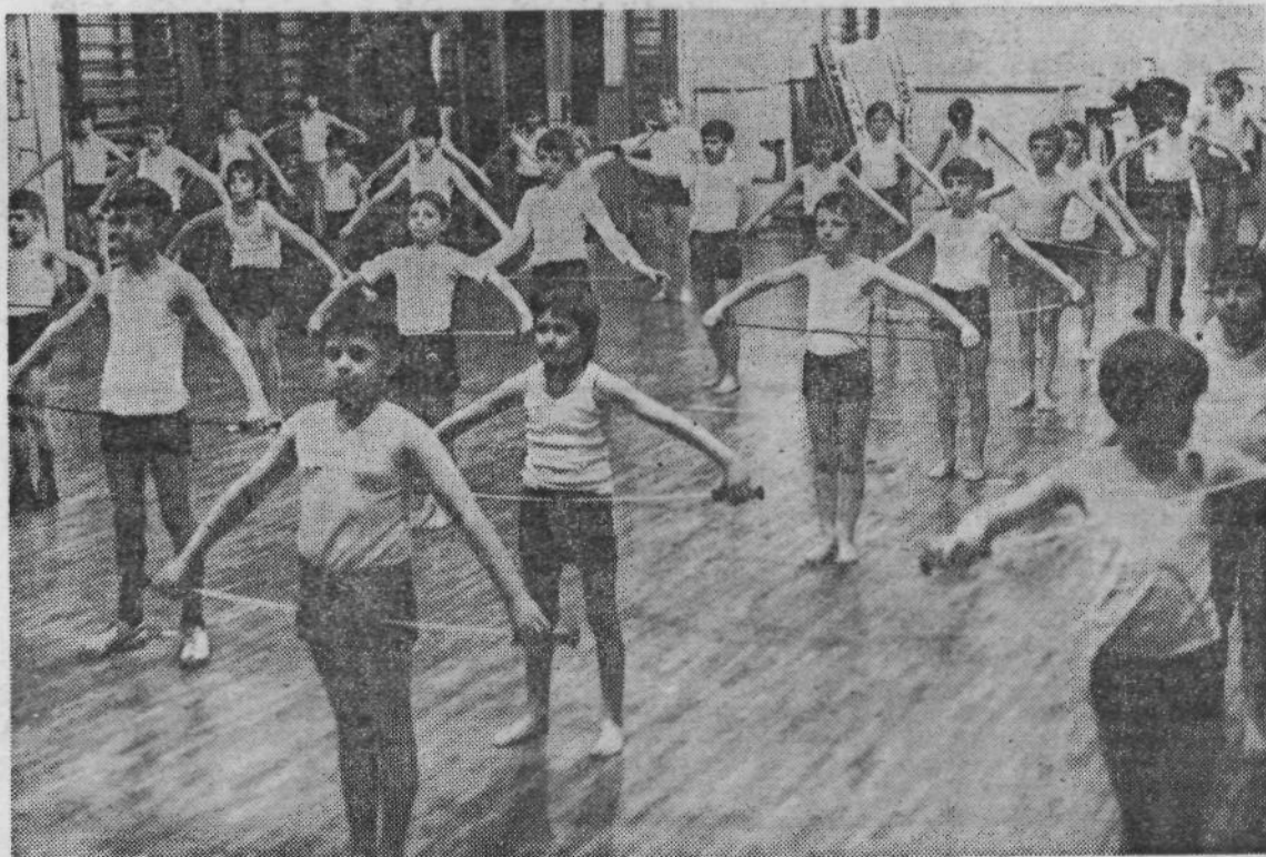
1973: Pionirji vadijo s trim palico

Julija 1862. leta se je nekaj ljubljanskih rodoljubov odločilo ustanoviti »telovadsko slovensko društvo«. Izdelali so tiskan poziv, v katerem so ljudem dali vedeti, da telovadba ali gimnastika »okrepča telo in dušo« in da bi bilo torej koristno, ko bi se tudi v Ljubljani ustanovilo telovadno društvo. Zato naj vsak, »ki bi hotel pristopiti tacemu društvu, to naznani s svojim podpisom«.