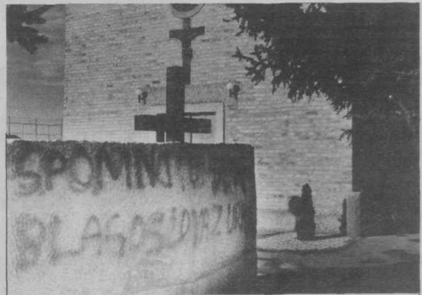
V septembrski številki NS smo poročali o odkritju spominske plošče in simbolnem pogrebu pobitih in zamolčanih žrtv na sostršnem pokopališču. Pred kratkim pa so zadnja stran spominske plošče popacali neznanci z napisom »Spomnite se blagoslova z Urha« in narisali rdečo zvezdo. Ob tem se sprašujemo, kdaj bo med nami zavladal razum, spoštovanje človeškega dostojanstva in pietete do umrlih, in kdaj bodo usahnile ideološke strasti in sovraštvo. (MKB,)