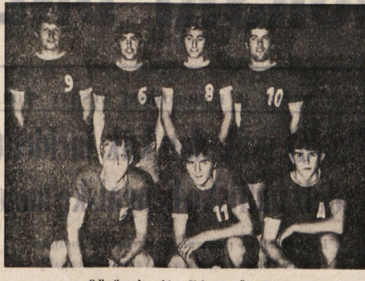
Odbojarska ekipa Velox iz Štandreža

SOFIJA, 30. - Na mednarodnem košarkarskem turnirju v Sofiji so dosegli naslednje rezultate: Moskva - Rim 73:58, Sofija - Habana 77:64, Bukarešta - Varšava 86:71, Ankara - vzh. Berlin 79:67. Na lestvici za prva štiri mesta je položaj sledeč: 1. Moskva 4 točke, 2. Sofija in Habana 2, 4. Rim 0.