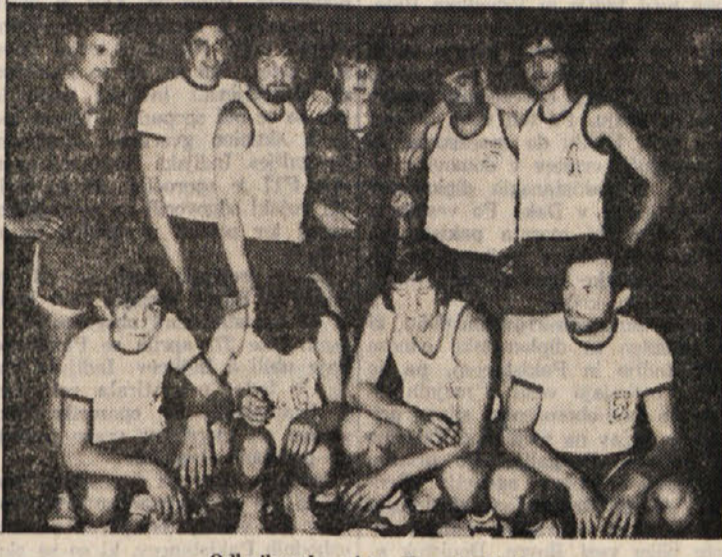
Odbojarska ekipa Dom iz Gorice