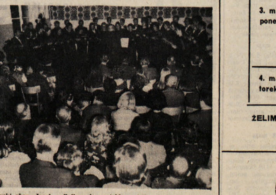
Fevski zbor «Jacobus Gallus» je preteklo nedeljo z velikim uspešnim nastopil v Nabrežini kot gost tamkajšnjega slovenskega prosvetnega društva «Igo Gruden».

Številne italijanske in tuje galerije so že pristale na sodelovanje pri organizaciji razstave Tropolnih del v vili Manin v Passarianu...»