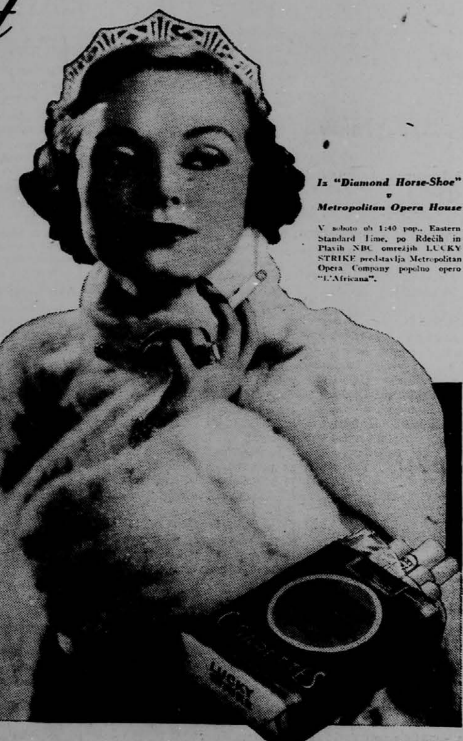
Is "Diamond Horse-Shoe" Metropolitan Opera House

spodnjih listov — ker so slabše kakovosti. Poslušujemo se samo srednjih listov, ker so najmilejši in popolnoma dozoreli za popolno kajo. Zato Luckies vedno lahko vlečejo, gore enakomerno — ter so vedno mile in rahle. Zato kadite Lucky, polno nabasano cigareto. In pomnite, "It's toasted" — za zaščito grla — za boljši okus.