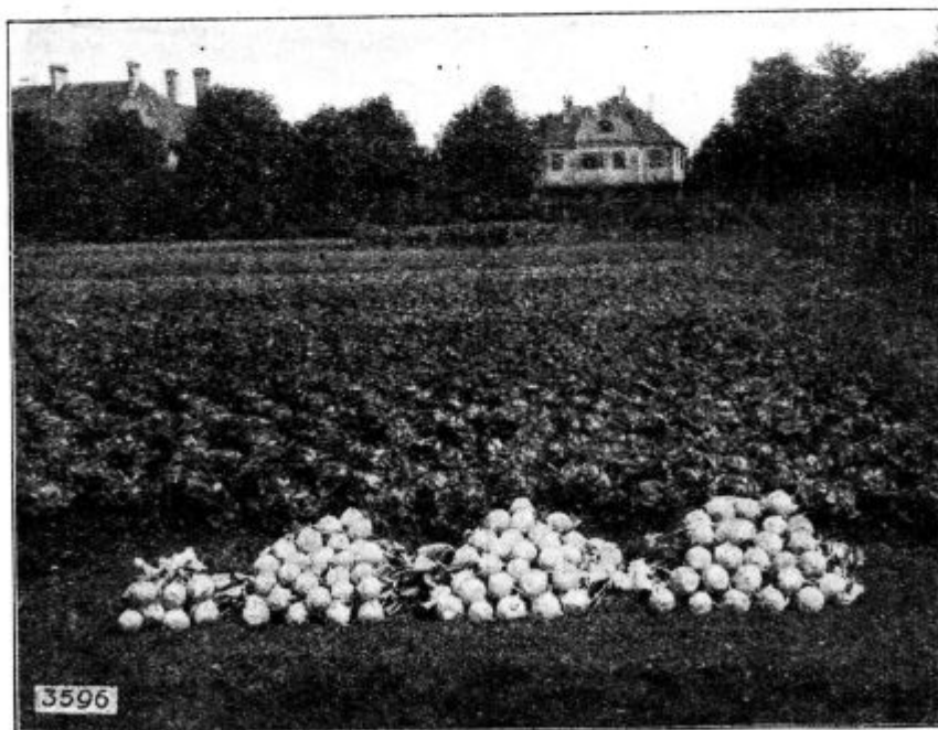
Pod. 14. Poskusno gnojenje kolerabe z umetnimi gnojili. Glej članek „Kalij pri zeljnatih rastlinah“.

Znano je, da vpliva kalij ugodno na zeljnate in korenške rastline in da je mogoče s pomočjo kalijevega gnojenja doseči lepe uspehe. Dognali so to številni poizkusi pri nas in drugod. Tudi pri vrtnih rastlinah se kalijevo gnojenje dobro sponaša zlasti pri kolerabi, ohrovtu in zelju.