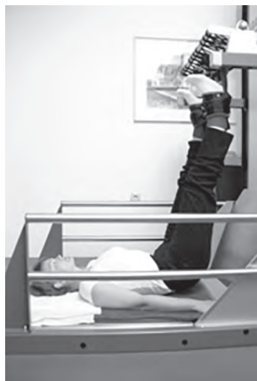
Slika 1: Dvig medenice.

GammaSwing (GammaSwing, TKH-Medical GmbH, Avstrija) je naprava za gravitacijsko trakcijo v obrnjenem položaju telesa, ki izvaja sočasno nihanje telesa. Terapija izvajamo v treh fazah: dvig medenice, dvig trupa in prosto visenje (slike 1 – 3).