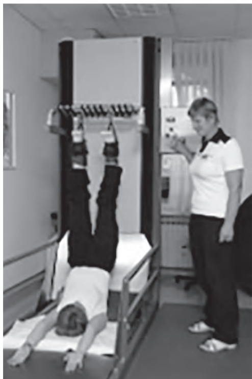
Slika 2: Dvig trupa.

Vsaka faza traja po pet minut, nihanje telesa izvajamo s frekvenco 60 nihajev v minuti (14). Terapijo uporabljamo za zdravljenje kronične bolečine v križu. Pri predpisovanju terapije upoštevamo indikacije in kontraindikacije, ki veljajo tudi za trakcije na drugih napravah (11, 14).