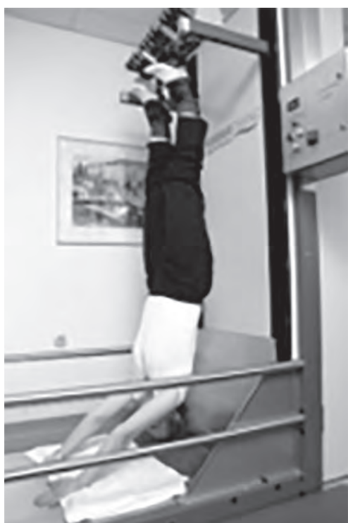
Slika 3: Prosto visenje.