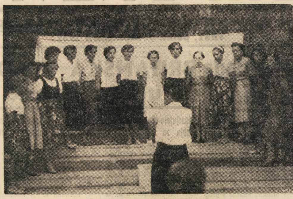
Zenski pevski zbor iz Podgore pri Gorici, ki je nastopil 31. avgusta v Sempolaju.

Prošnje za pripustitev k natečaju je treba vložiti na ministrstvo za prevoze (Ministero dei Trasporti — Ispettorato Generale della Motorizzazione civile e dei Trasporti in concessione) v teku 90 dni, ko je bila omenjena odredba objavljena v Uradnem listu.