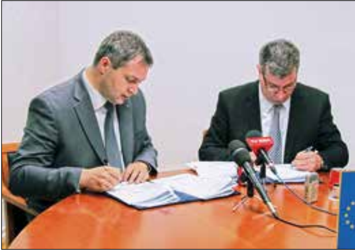
Podpis pogodbe za kanalizacijo in čistilno napravo

velik uspeh. Ta dan bo gotovo zapisan kot pomemben v zgodovini občine. Prepričan je, da bo občina ob že toliko vloženega truda za pridobitev nepovratnih sredstev projekt uspešno pripeljala do konca. Poudaril je pomembnost črpanja evropskih in državnih sredstev, poseben pomen pa ima reševanje okoljskih problemov, saj podatki o stanju zraka in površinske vode v R Sloveniji niso ravno zadovoljivi. Pitna voda mora ostati javna dobrina.