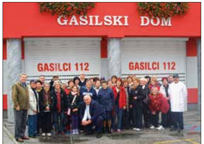
Pred gasilskim domom na Studencih

Ko smo »splavarjenje« končali, smo se ponovno vkrkali na avtobus. Žal pa je začelo tudi močnejše deževati. Središčani pa se seveda ne damo in smo tako uporabili avtobus še za ogled mestnega predela, ki je bolj povezan z našimi gostitelji iz turističnega društva na Studencih. Posebna zanimivost v tem delu Maribora je Jožefova cerkev, ki hrani čudovite baročne umetnine in izjemno lepo prižnico. Tamkajšnje orgle se mogočno oglasijo pod prsti organistov.