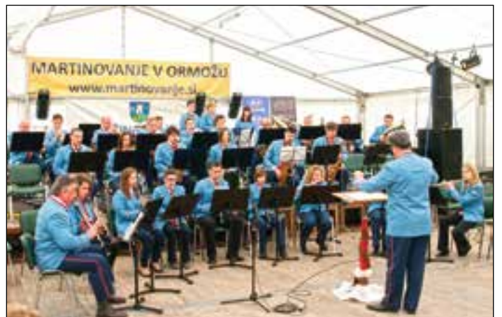
Tekmovanje godb v Ormožu

Vsi tisti, ki ste ta koncert zamudili, boste imeli priložnost slišati središke godbenike na Štefanovem koncertu 26. decembra.