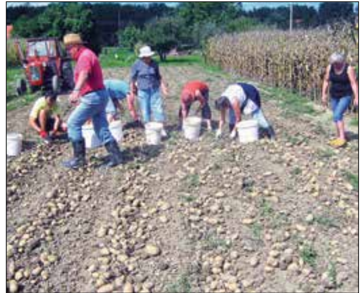
Družno pobiranje bogatega pridelka

Trdnega zdravja, pozitivne energije, čilosti in veselih trenutkov Vam želimo tudi po osemdesetem!