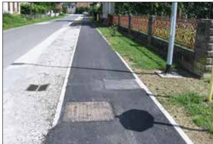
Pločnik v Kolodvorski ulici