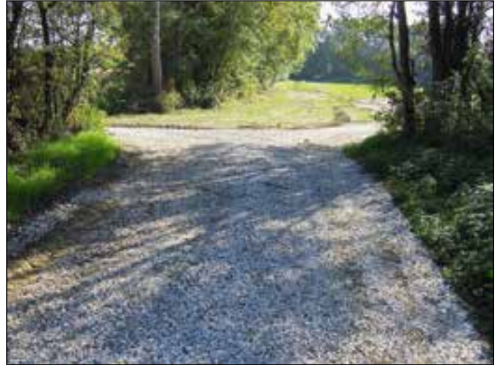
Sanirana javna pot proti Dravi

Veliko škode po poplavah 2012 je bilo tudi na vodotokih, posebej na Trnavi, kjer je južno od železniške proge odneslo 150 m nasipa, ki ščiti njivske površine. Voda iz Trnave se je do nujne sanacije nasipa in ob večjem vodostaju Trnave ali reke Drave izlivala na njivske površine in povzročala še dodatno škodo. Tudi sanacija njivskih površin je bila zelo otežkočena. Oceno škode po poplavah in