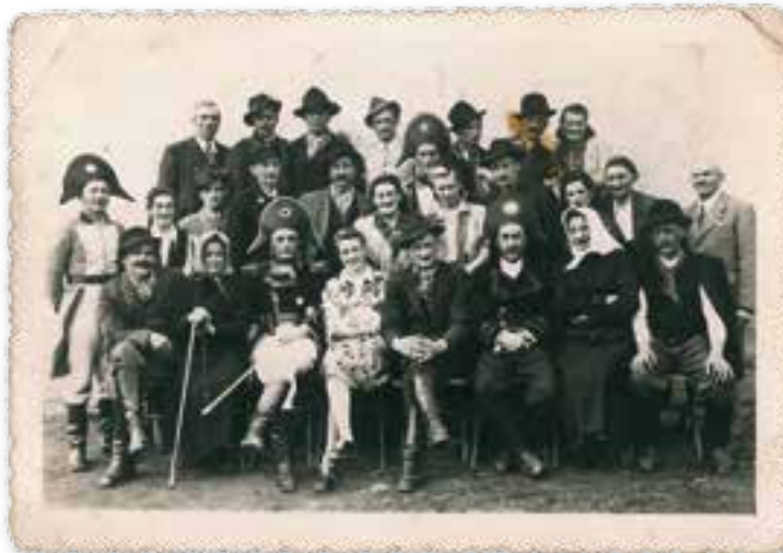
Igralski zbor prve predstave Naša kri