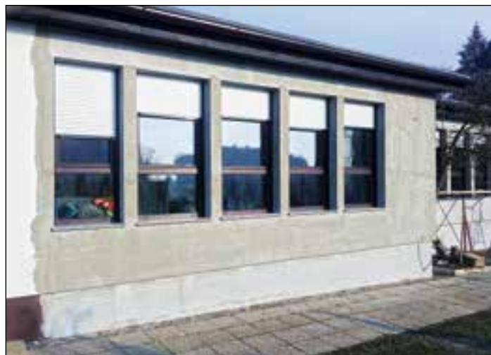
Energetska sanacija vrtca Navihanček

Vrtec ima sedaj novo »suknjo«, ki bo pomenila velik prihranek pri kurjavi, bivanje v njem pa bo veliko prijetnejše in toplejše. Celotna vrednost investicije je bila 42.000 evrov za fasado, okna, vhodna vrata in izolacijo na podstrešju. Zamenjava radiatorjev je bila v vrednosti 3.600 evrov.