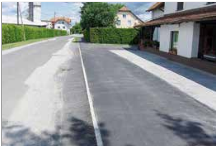
Pločnik v Kolodvorski ulici