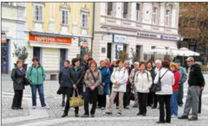
Na glavnem trgu

zanimivo podobo starega mesta, ki je živelo z reko, in novejšega, ki je živelo z železnico in industrijo. Od spomenika NOB, Kojak, ki je še danes opomin človeški brezumnosti, smo se podali po mestu do obnovljenega Štukljevega trga, zaznali utrip Gosposke ulice in si na Glavnem trgu ogledali zanimivo arhitekturo s prevladujočim baročnim kužnim znamenjem. Podali smo se do stolnice in občudovali mogočnost stavb, ki opredeljujejo bistvo škofijskega, univerzitetnega, izobraževalnega in upravnega središča severovzhodne Slovenije. Seveda ni šlo brez kratkega obiska gledališča.