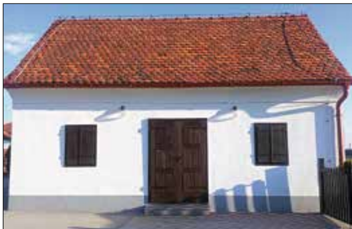
Obnovljena stara mrliška vežica

Hidroizolacija stare mrliške vežice na pokopališču je bila zaradi vlažnosti sten izvedena že v letu 2011. V letu 2012 je bil odstranjen star omet, da so se stene do letošnjega leta presušile. V septembru in oktobru je vežica dobila novo fasado, zamenjani so bili žlebovi, odtočne cevi in vetrne obrobe, po potrebi tudi neustrezna kritina. Zamenjano je bilo eno okno, ostala okna in vhodna vrata, skupaj z mrežami na slepih oknih so bila obnovljena. Obnovljen je bil tudi vhod v vežico. Stara vežica je sedaj lepša. Videz in stara podoba s prvotnimi oblikami je še vedno ohranjena. Vrednost fasade in obnove stavbnega pohištva je bila 4.800 evrov, kleparskih in krovskih del pa 1.300 evrov.