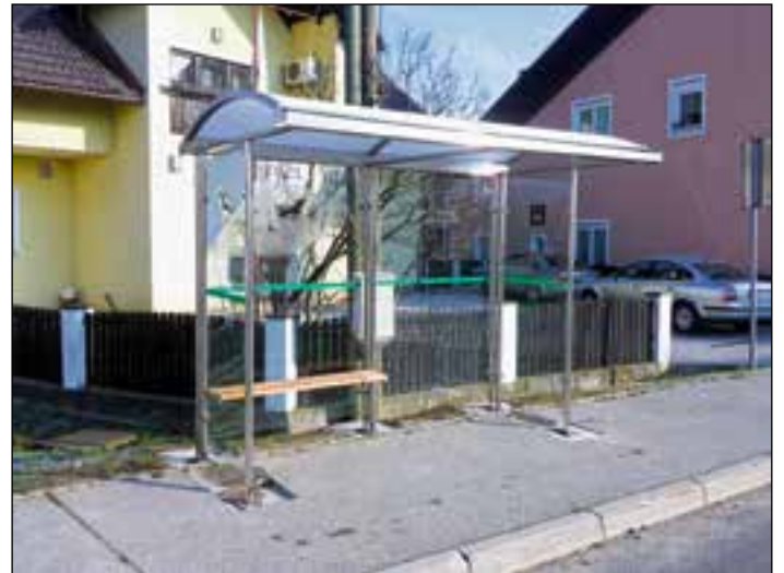
Avtobusno postajališče na Grabah

Za ta projekt je bilo zagotovljenih 10.000 evrov lastnih sredstev, ki smo jih namenili za nabavo treh avtobusnih nadstreškov v naselju Grabe in so bili postavljeni v začetku decembra. Vrednost investicije je 9.600 evrov. Po finančnih zmožnostih bodo manjkajoči nadstreški v občini postavljeni v naslednjih letih.