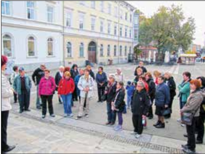
Začetek ogleda Maribora

Še nekaj ulic in uličic in že smo morali pohiteti na avtobus, ki nas je odpeljal do izhodišča za pot na splav. Turistični delavci na splavu so nas sprejeli, kot se spodobi, z dobrodošlico in glasbo. Seveda smo tudi zaplesali, krstili našo predsednico za splavarko Miciko in se malo podprli, ker prazna vreča pač ne stoji pokonci. Vreme nam sicer ni bilo najbolj naklonjeno, a smo kljub temu spoznali mogočnost in eleganco mariborskih mostov, čudovito obvodno stanovanjsko arhitekturo. Opazili smo veliko razliko med levim in desnim bregom Drave. Na levem staro mesto z jasno vidnimi - stoletja starimi - strukturami in desno industrijski del, ki je zadovoljeval drugačne potrebe. Mostovi pa so ti dve nasprotji povezali v