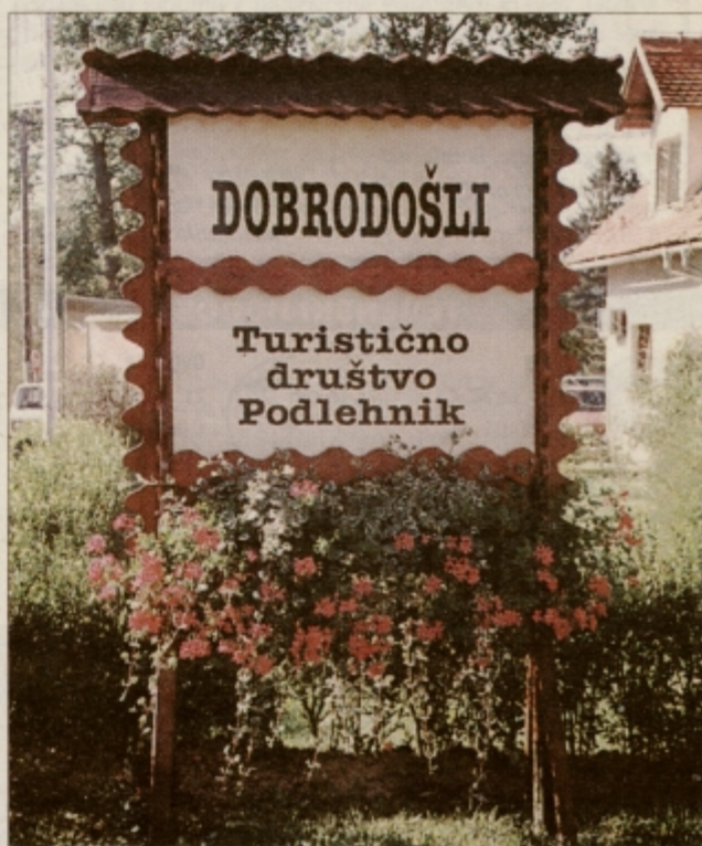
Tudi prijazne in s cvetjem okrašene table so delo Turističnega društva Podlehnik