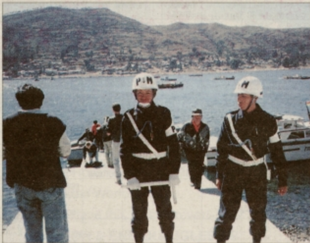
Najožji del jezera Titicaca, kjer vozi trajekt, je zastražen

oliko. Zaradi tega je vsaka vožnja unikatna in samosvoja ter zmeraj polna novih dogodkov. Pripeti se, da te kak otrok natančneje pogleda, te otipa, vščipne ali celo ugrizne, da se kdo ob tebi podela v hlače, na avtobusu urinira ali kako drugače pritegne tvojo pozornost. Najbrž so ravno takšne in tem podobne malenkosti tisto, kar daje celoti piko na i in vodi do popolnosti nekega doživlja.