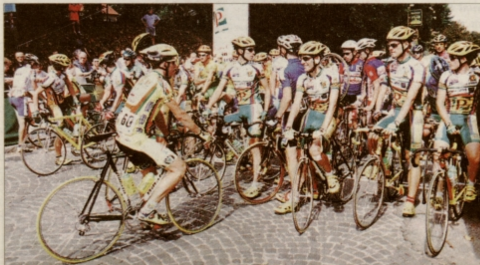
Pred startom nedeljske cestne dirke.