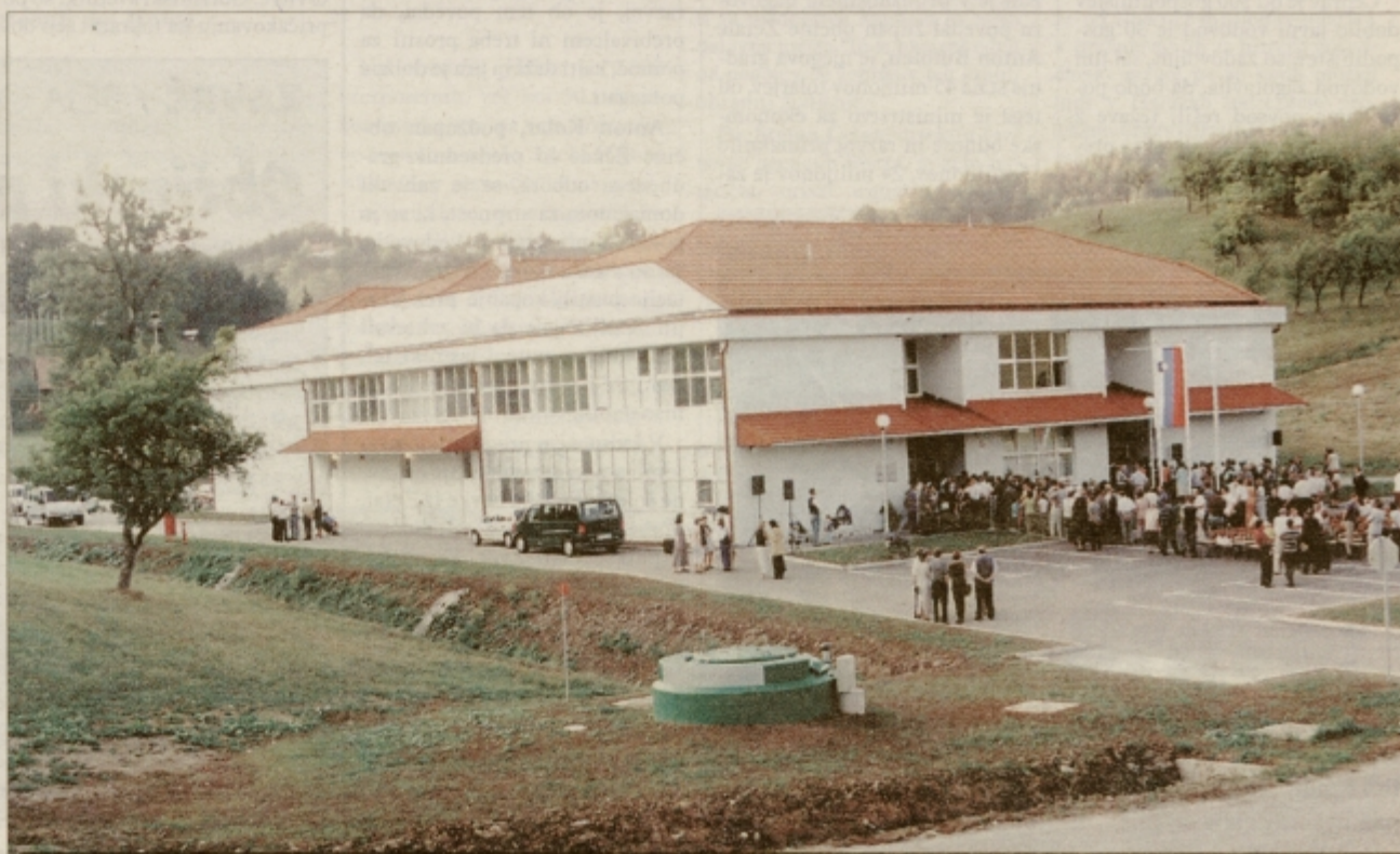
ŽETALE: Novo šolsko leto v novi, moderni šoli.