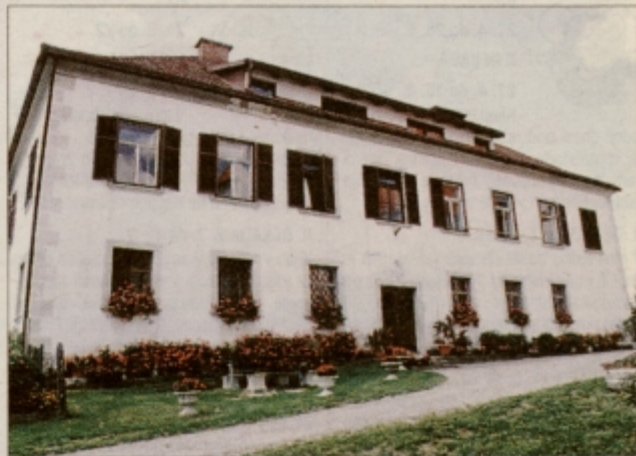
Urejeno župnišče pri Sv. Trojici