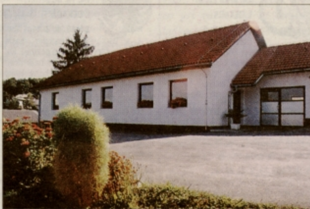
Najlepše urejen poslovni objekt Feguševih iz Podlehnik 2