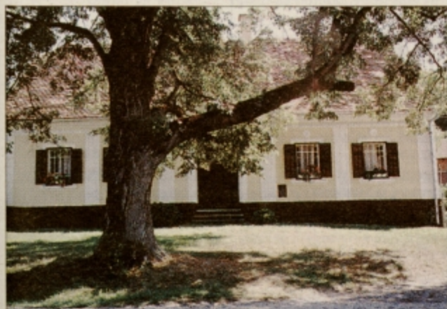
Priznanje za ohranjanje arhitekturne dediščine: dom Marice in Franca Mauzerja iz Podlehnik

PODLEHNIK / AKCIJA TURISTIČNEGA DRUŠTVA IN SVETOVALNE SLUŽBE