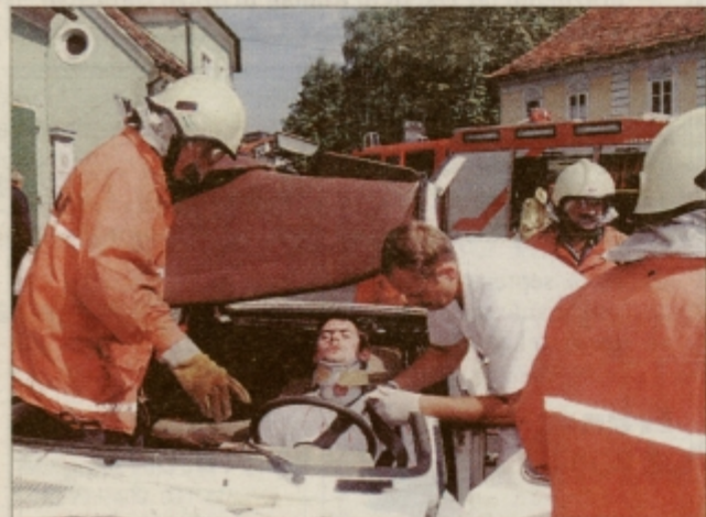
Hudo ranjenega voznika so iz smrtonosnega objema pločevine rešili s pomočjo hidravličnih klešč.