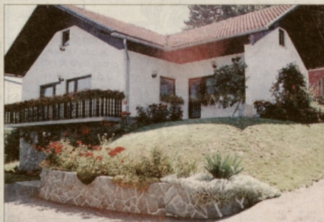
Prvo mesto med najlepšimi domovi: Lidija in Franc Večerič iz Stanošine 12/b