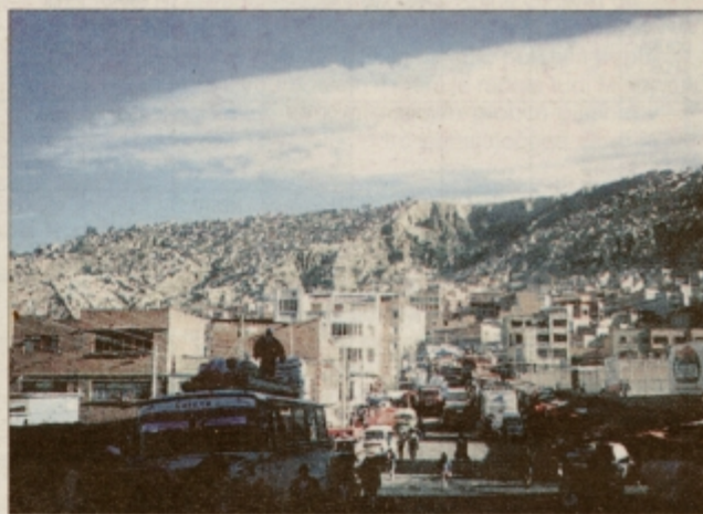
La Paz - mesto, ki leži na nadmorski višini med 3200 in 4100 m

La Paz je mesto, kot ga za tamkajšnje razmere nisem bil vajen. Je lepo, grdo, drugačno od ostalih, čisto, umazano in predvsem polno kontrastov. Je mesto, ki ga večina vzljubi že na prvi pogled, ta predstava pa se kasneje lahko spremeni. Najlepsi je prvi pogled, tisti z roba Altiplana. S spuščanjem niže se vse bolj razkrivata beda in blišč. Beda je vidna predvsem tujcu, saj se zdi, da tamkajšnji ljudje pojmu beda ne pripisujejo enakega pomena kot mi.