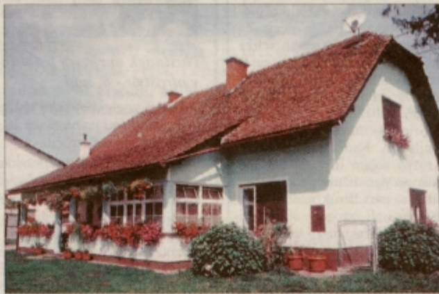
Ob cesti, ki vodi na Ptuj, na Spodnji Hajdini 28, opazimo kmetijo Gojkošek

Število gnezd se od leta 1996 povečuje in je doseglo v letu