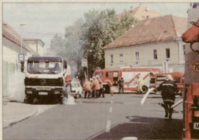
Na Vinarskem trgu v Ptuj je "počilo" in gasilci so prihiteli k avtomobilski cisterni, iz katere se je valil dim, saj je vanjo trčil osebni avtomobil