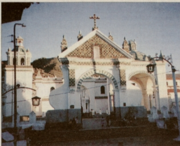
Katedrala v Copacabani, kjer domuje črna Madona

Čeprav so avtobusi in ostala prevozna sredstva v Boliviji na še kar zavirljivi udobnostni (kakovostni) ravni in so celo boljši ali vsaj primerljivi z našimi, pa so ceste še predpotopne in veliko slabše od domačih slovenskih. Problem je prenatrpanost javnih vozil, saj včasih dobesedno hodiš po ljudeh. Tudi vonjave spominjajo na domače hlevske parfumerije, vendar se na te hitro privadiš; celo več, lajšajo ti osebne prebavne zadržke, saj ego pozabi na moralno