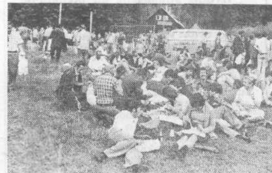
Kosilo na Rovtarici

Gostje so bili navdušeni tudi nad lepotami Bohinja in Bleda, kjer pa je začelo neusmiljeno deževati. Po ogledu muzeja v Begunjah, ki je borcem obudil spomine na težka vojna leta, mlade pa spodbudil k razmišljanju, kako težko je bila priborjena svoboda, se je kolona avtobusov vrnila v Ljubljano, kjer so se gostitelji poslovili od gostov in jim zaželeli srečen povratek domov.