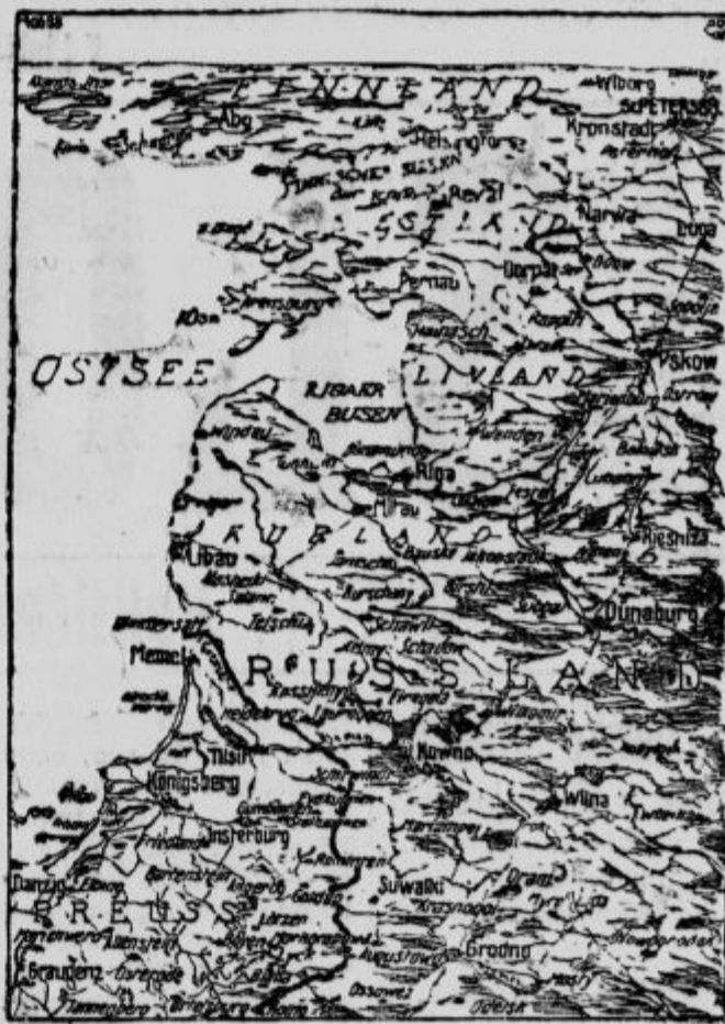
Zemljevid k nemški zmagi pri Rigi.

Prvi generalni kvartirni mojster pl. Ludendorff.