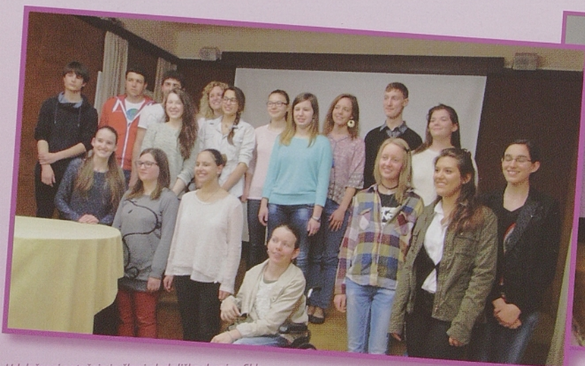
Udeleženci natečaja in člani gledališke skupine SKK med recitalom