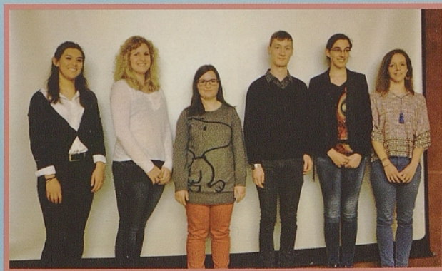
Zmagovalci in avtorji priporočenih prispevkov literarnega natečaja Skk-Mosp 2015