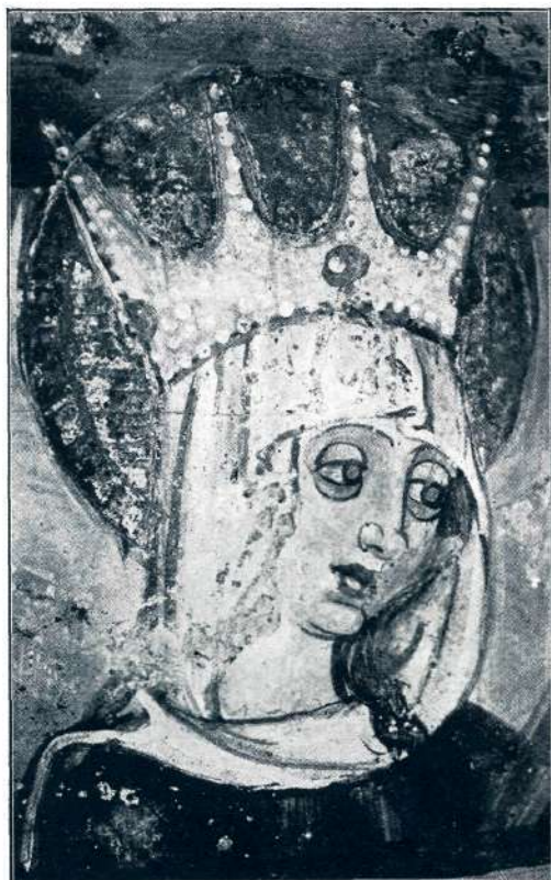
Sl. 14. Sv. Peter na Vrhu, sv. Helena (2. pol. XV. stol.).