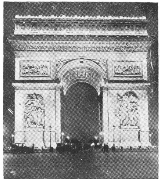
Pariz — Slavolok zmage