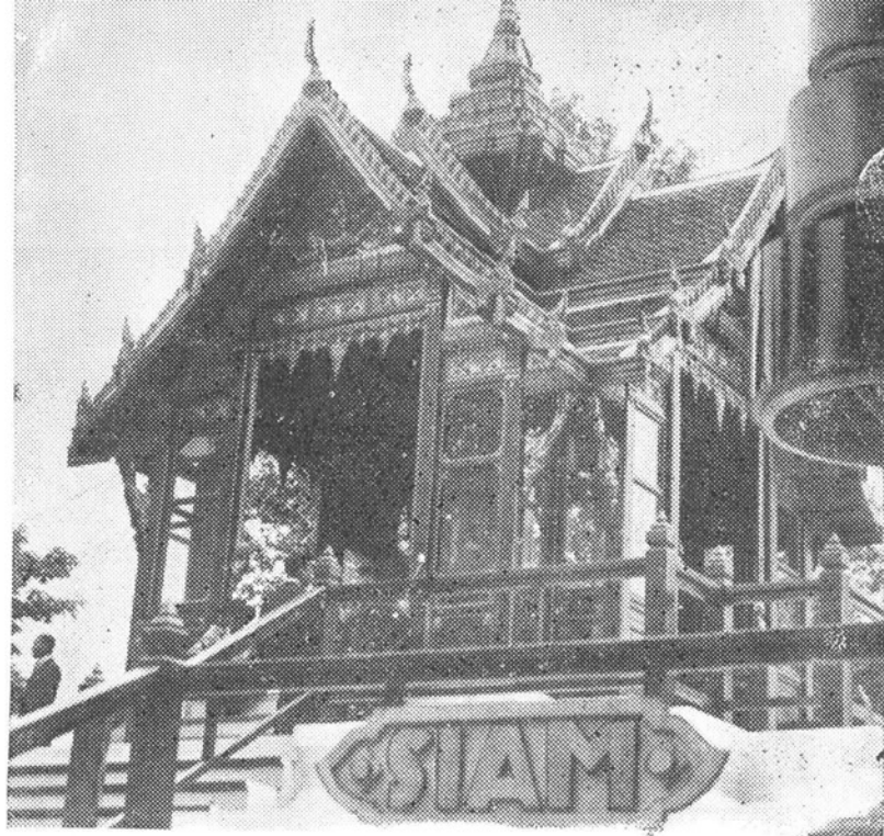
Siamski paviljon na pariški razstavi

Boris je dan za dnevno opazoval, skrit kje med hišami ali še rajši med grmovjem, dolge kolone težko natovorjenih in obupno stokačih voz, ki so se, zaviti v oblake prahu, pomikali po cesti. Mnogokrat se je zalotil, da išče med vozmi in vozniški pravzaprav le enega: Martina; ... da ga drugi ne zanimajo več, da so mu postali tuji in da je izginila vsa jeza nanje, ki je toliko let tlela v njem. Zakaj je izginila, si ni mogel razjasniti, — le to je vedel zagotovo, da ga je izmed vseh v tovarni začel zanimati edinole Martin — in da tudi na njega ni jezen. Pa vendar se mu je umikal; bal se ga je srečati, kljub temu, da je vzrastla v njem rahla simpatija do njega, ki jo je sicer skrival, a je ni mogel zatajiti in mu ni bilo njegovo veselo petje, kadar je v večerih razvažal opeko, sedeč na vozu, z iztegnjeno nogo pred sabo in vihtečim bičem v roki, nič manj všeč, kot pesem orgel ob nedeljah v cerkvi.