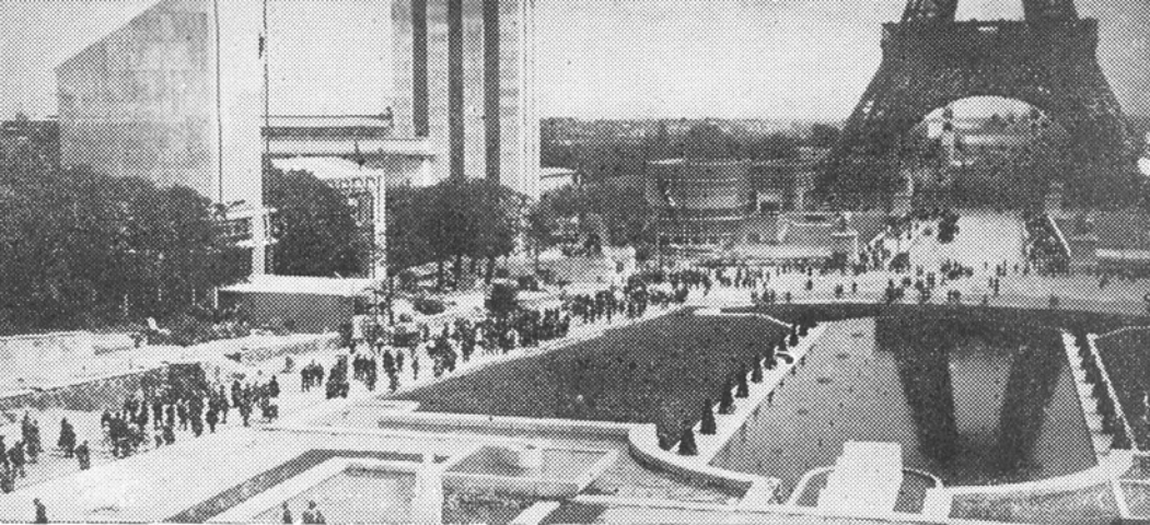
Pariška svetovna razstava — novi bazen Trocadéra

začela prepuščati polagoma vodstvo privatnim industrijskim družbam.