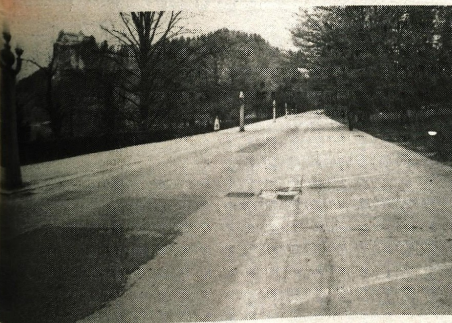
Polno praznega - Pravkar minuli vikend ni le zredčil cest, pač pa so vozniki lahko izbirali tudi parkirni prostor. Tudi gostinci so bolj počivali in tolžili, da bo naslednji vikend drugačen.

GLASILO SOCIALISTIČNE ZVEZE DELOVNEGA LJUDSTVA ZA GORENJSKO