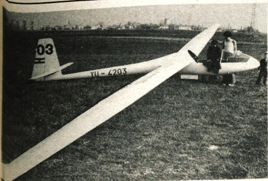
ZMANJKALO SAPE – Dnevi lepega vremena so razveselili pilote centralnih letal. Ure in ure so krmarili nad Gorenjsko, jadralci leskega centra so dosegli tudi nekaj rekordov v preletu in dolžini leta. Vsakdanost jadralcev pa je tudi zasilni pristanek, če zmanjka višine in nagajajo zračni tokovi. Za pristanek jadralca ni potrebna velika ravna površina. (j.k.)