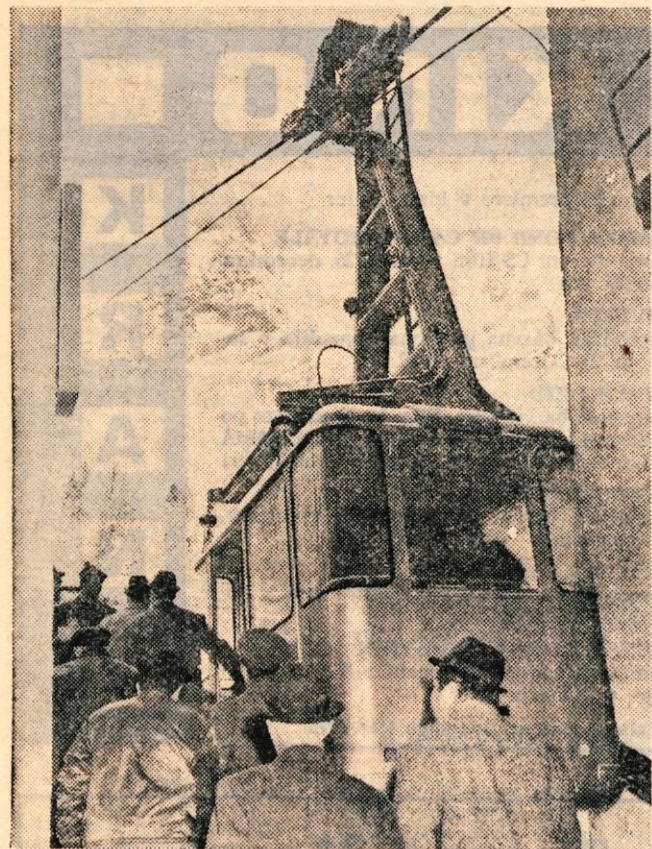
Prenovljena gondolska žičnica na Vogel je gotovo velika pridobitev za bohinjski turizem, obenem pa ponovna delovna zmaga Transturista iz Škofje Loke. Ena sama gondola bo lahko v pičlih štirih minutah prepeljala na 1500 metrov visoki Vogel kar 30 smučarjev. (jk)