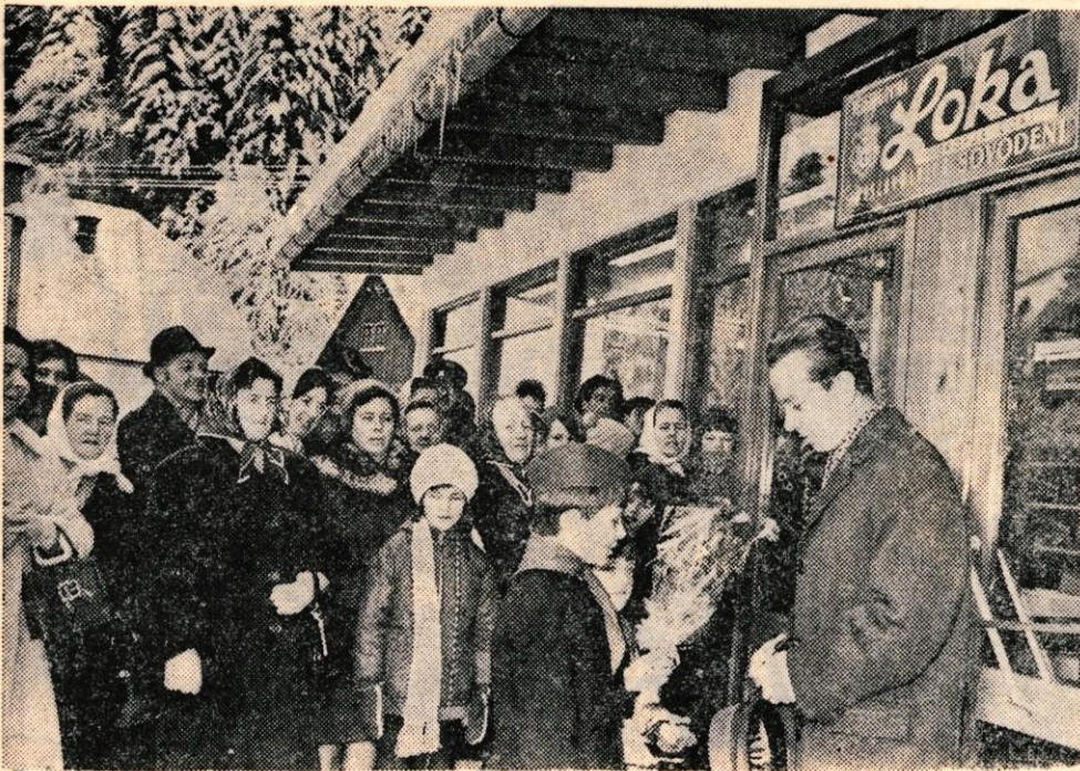
V nedeljo je v Sovodnju v Poljanski dolini vletrgovina Loka odprla samopostrežno trgovino