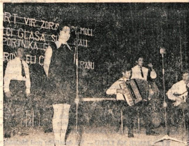
Veseli trgovci s pevko Bogatajevo