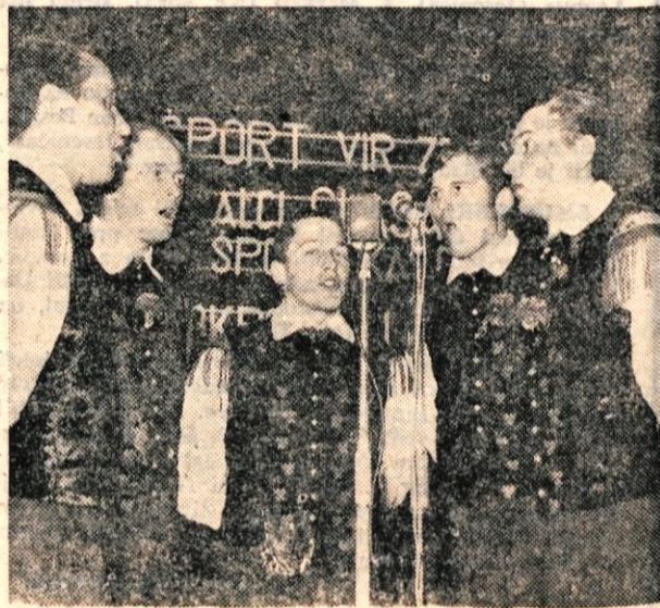
Fantje s Praprotna so »pomagali« Slaku