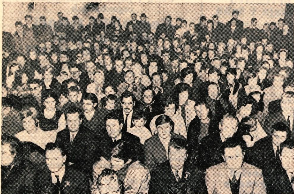
Dupljanci pravijo, da že dolgo ni bilo take prireditve