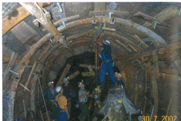
Izdelava objekta s kombinacijo aktivne (sidra) in jeklene ločne podgradnje.

Nov tehnološki proces omogoča zvezno večanje nosilnosti od minimalno potrebnih vrednosti do vrednosti, ki močno presegajo dosežene nosilnosti jeklene ločne podgradnje. Ta prednost je neprecenljivega pomena, v kolikor bomo v jamah Premogovnika Velenje še naprej večali prečni presek izdelanih jamskih objektov.