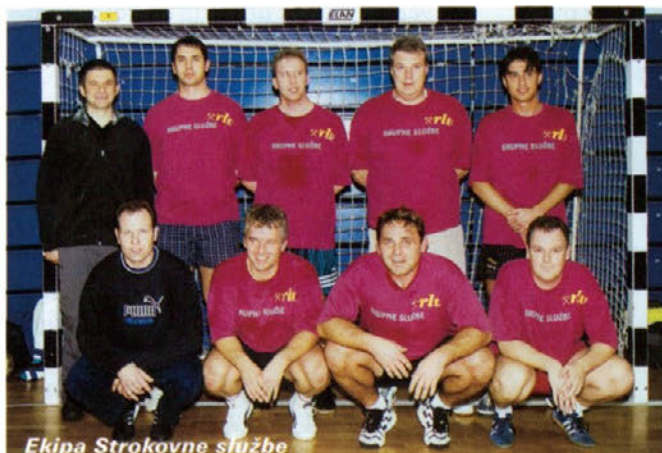
Ekipe Strokovne službe