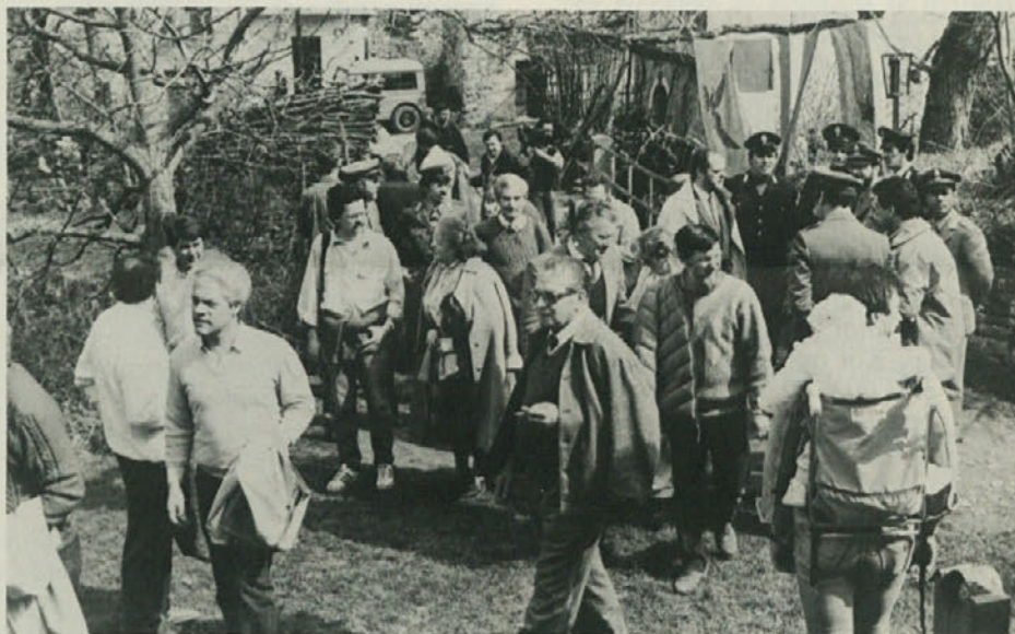
Dolina, 11. in 12. aprila 1987: že tradicionalni spomladanski sprehod v dolini Glinščice ob odprti meji, simbol sožitja in dobrososedskih odnosov med državama, kjer se dva dni po stezi prijateljstva srečujejo Slovenci in Italijani, je razburil mračne sile, ki si želijo nazaj v dobo medsebojne mržnje: ko jim ni uspelo ob priliki žalostnih dogodkov na našem morju zastrupiti ozračja v mestu, jim ne preostane drugega kot podlo mazanje spomenikov v varnem naročju noči.

zaposlitvijo žensk (ki torej ne morejo več nadomestiti kot v preteklosti socialne službe) se danes kopičijo. To je tudi razlog za pretirano hospitalizacijo ostarelih. Po zadnjih podatkih plačuje naša država za ostarele ki so «parkirani» v bolnicah, 5 tisoč milijard. S primernimi službami, kot so day hospital, oskrba na domu in podobne, bi se lahko dve tretjini teh takoimenovanih nepravilnih bolnikov lahko zdravilo doma. Državni in deželni zdravstveni načrti predvidevajo ukrepe, ki bi hospitalizacijo zmanjšali na polovico. Toda to se danes izvaja tako, da bolnika po pozdravljeni akutni fazi bolezni enostavno odpustijo, ne da bi se kdaj vprašal, kako potem, ko ni teritorialnih struktur za rehabilitacijo in drugih dostopnih oblik oskrbe. Bolezni tako postanejo kronič-