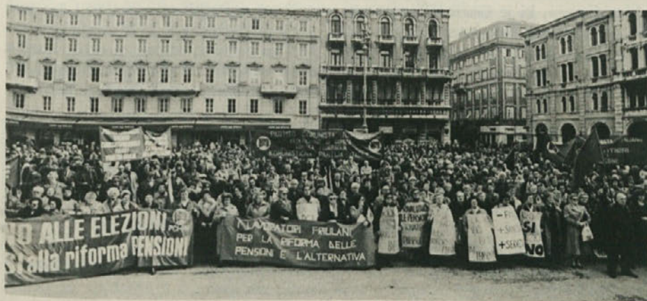
Manifestacija KPI za delo in pravičnejše pokojnine je zbrala na trgu Unità in po mestnih ulicah delavce in upokojence vse dežele.

Kaj storiti sedaj? Če bodo volitve, kot vse kaže, namesto referendumov že sredi junija, se moramo nanje temeljito pripraviti. Vedeti moramo, da je cirkus radijskih in televizijskih izjav, pokerskih bluffov in navideznih polemik v režiji Craxija in De Mite gotovo vzbudil ljudski gnev, pa tudi veliko zmedo. V tej zgagi je KPI najboljše jamstvo zares naprednih političnih izbir, premošitve sedanje razpadle večine in nastanjanja novih razmer. To pa bo odvisno od razmerja sil v veliko večji meri kot od same politične volje. Kajti samo velika in močna KPI lahko utre pot oblikovanju napredne in laične večine, ki naj v Italiji uresniči potrebne reforme in moralizacijo javnega življenja. V naspotnem primeru nas čaka nadaljevanje petstrankarske zgage.