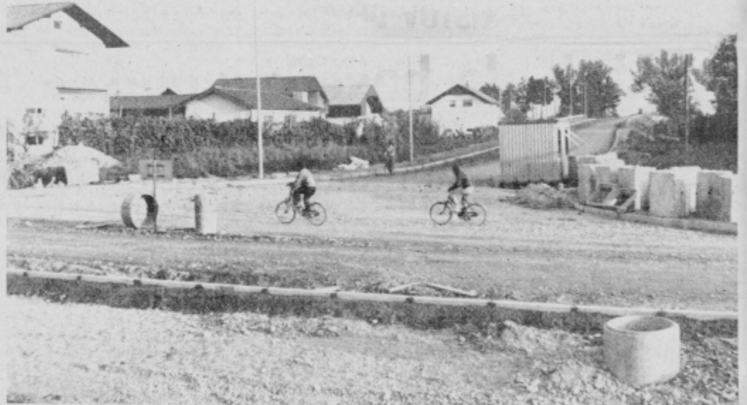
Del ptujске obvoznice z nadvozom ob Natašini poti je v zadnji etapi gradnje.

moramo tudi v naslednjem 5-letnem obdobju pritegniti k sodelovanju republiško skupnost za ceste, saj bomo s ptujsko obvožno cesto praktično prestavili del magistralne ceste Ptuj—Ormož. S tem pa bomo seveda rešili tudi daleč najtrši prometni oreh — to je istonivojsko križanje magistralne ceste z železniško na Or-