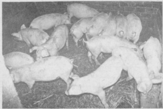
Pogled v hlev