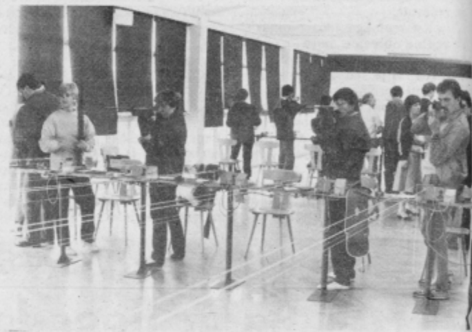
S tekmovalstva v streljanju