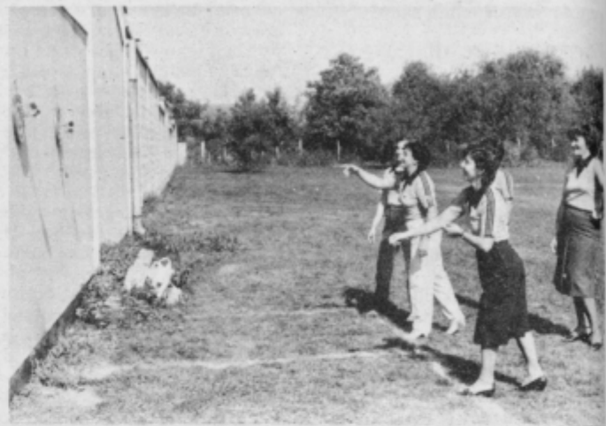
Pikado — elitna disciplina ptujske Perutnine na športnih srečanjih