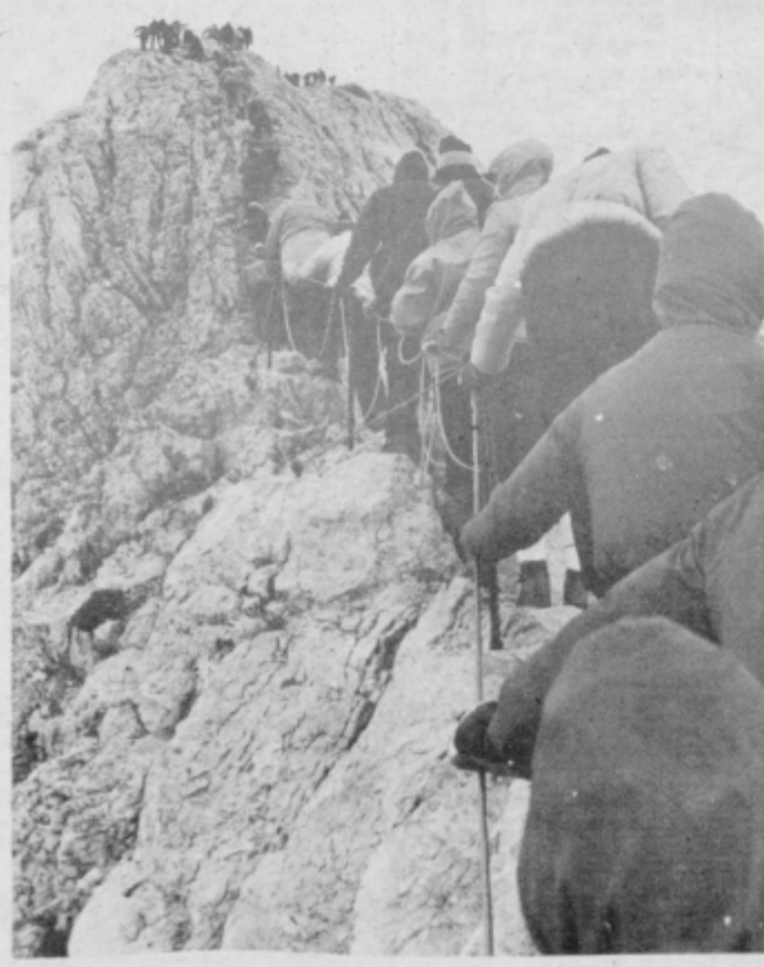
Vzpenjanje na Triglav

»Nismo vse hitele, res ne, za...« palica švigne skozi zrak, prvič, drugič, tretjič. Pod nobenim pogojem si ni pustil vzeti besede: »Tu ni nobenega samoupravljanja!« zagodrnja in opravičilo. »Tukaj samo jaz odločam. Jaz odgovarjam za vas! Naj se kateri kaj zgodijo? Krivda bo na mene padla! Rajši vas premlatim!« vpjaje. Izgubiti oblast nad seboj? S surovostjo nas je prepričal, da misli resno. Razumele pa še vedno nismo, česa nas krivi. Vse smo bile kaznovane s hitro hojo, prišle izmučene sem, zdaj pa nas tukaj zmerja in telesno obračunava. Trikrat prizadete. Kaj je narobe? Nesporazum je bil še vedno zavil v skrivnost. »Mi smo odrasli? Mi?« Skozi spomine se vrnem domov. Kako rešujemo nesporazume? Probleme? Nič drugače kot ta. Pustimo se preslepiti neugodju, strahu, ki nas preganja v obliki dvomov in skrbi! Zapletamo jih, glasno, večkrat preglasno, da prevpijemo krivico, ki smo jo storili sibožjim od nas. Celo tako daleč gremo, da začnemo zlorabljeni nasprotnikovo preteklost, ga vanjo vreči, samo da izsilimo prednost, ki je nimamo. Sram me je, v dno duše me je sram, da spadam v krog odraslih. Goljufamo druge, presenečeno spoznamo, da smo ogoljufali sebe. Ko nismo več sposobni ali