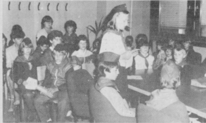
Z občinske pionirske konference v Srednješolskem centru v Ptuj.