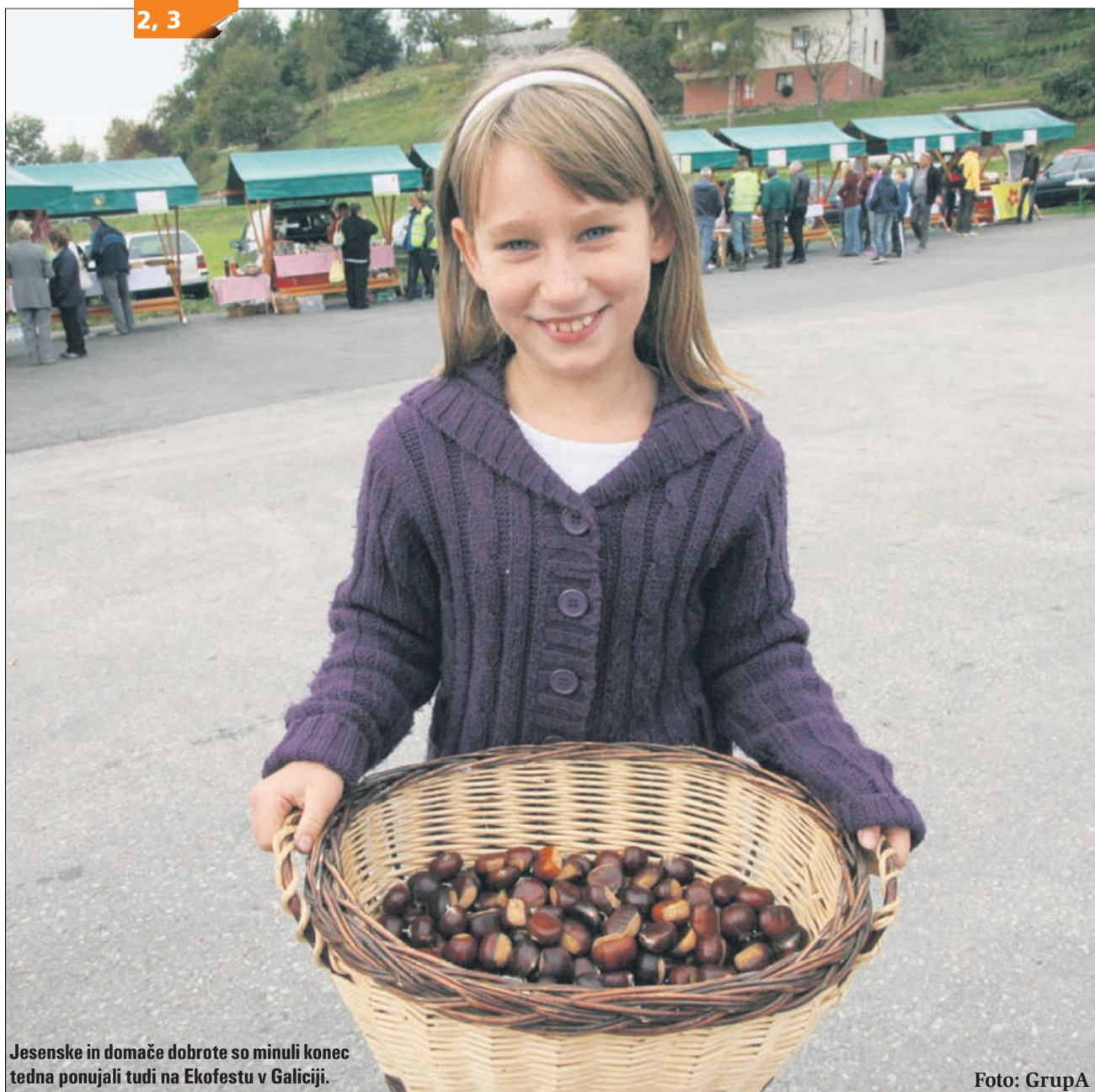
Jesenske in domače dobrote so minuli konec tedna ponujali tudi na Ekofestu v Galiciji.