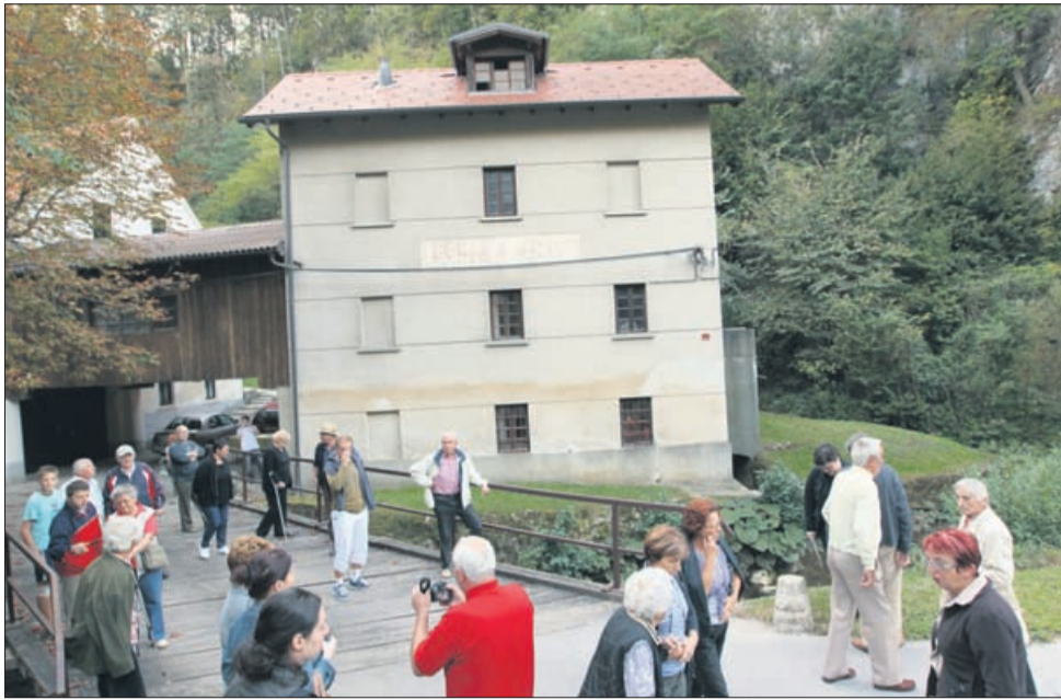
Ferležev mlin danes ne melje več, skriva pa ogromno zanimivih zgodb. Na fasadi se še pozna zadnja velika poplava.