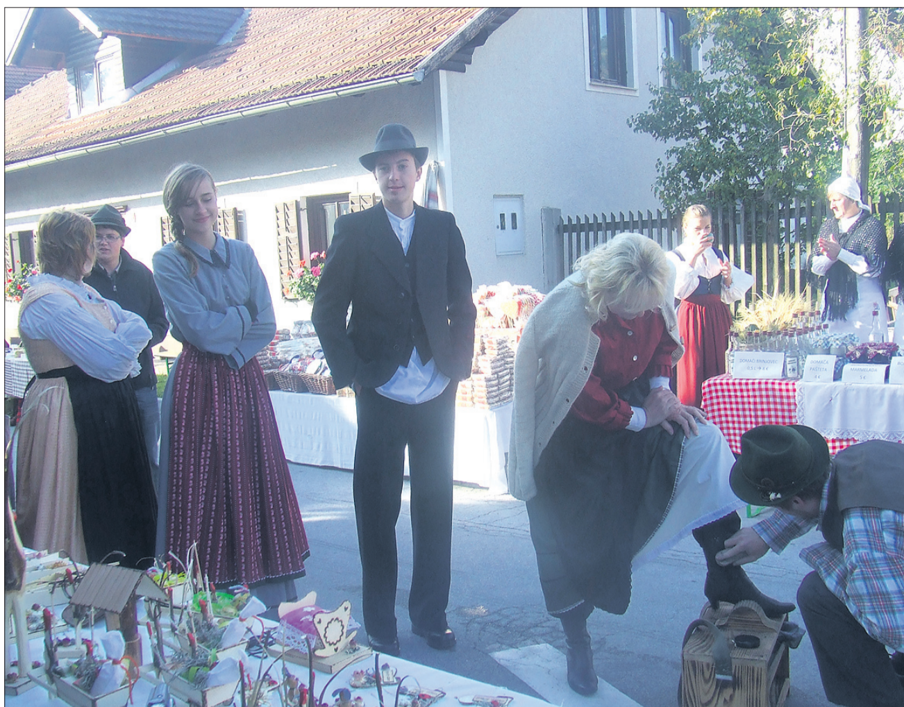
Letos si je pri »šuhpucerju« čevlje čistila tudi trška gospoda. Oblačila, posebej izdelana za Lenartov sejem, so nastala na podlagi še ohranjenih virov o nekdanji oblačilni kulturi v trgu Rečica.