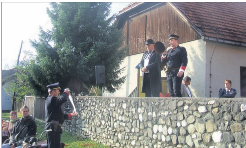
Po pozdravu trškega župana sta navodila sejmarjem in »firbcem« izdala policajca, ki sta skrbela tudi za »pošteno vago in kupčijo«.