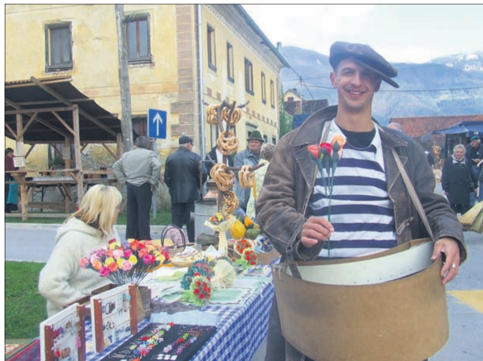
»Pičkurin« je z drobnimi pripomočki, od šivank do kakšnega mazila, v preteklosti oskrboval kmetije. Za podobne sejem je v svojo krošnjo naložil priložnostna darilca, med obiskovalci pa z igro »par-nepar« skušal iztržiti kar največ dobička.