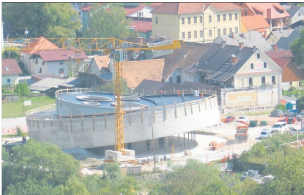
Z gradbišča Kulturnega središča evropskih vesoljskih tehnologij v Vitanju, kjer bodo med drugim razstavljeni predmeti iz ameriškega in ruskega vesoljskega programa. Njegova arhitektura spominja na znanstveno delo Hermana Potočnika Noordunga.

VITANJE – Gradnjo prestižnega vesoljskega središča je treba dokončati, so bili prepričani na izredni seji občinskega sveta, ki se je sestal v petek. Občina bo izvajalcu CM Celje, ki podizvajalcev ne more plačati, pomagala tako, da je v petek pristala na višjo ceno od pogodbene ter bo zato najela dolgoročni kredit.