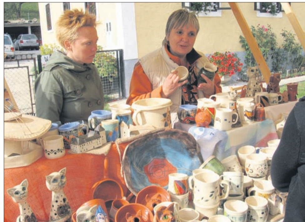
Dobrodelna unikatna keramika zavoda Ekoalt Vindol iz Lesičnega za revne otroke od Črne gore do juga Indije. Na levi strani je replika gradu Podsreda.