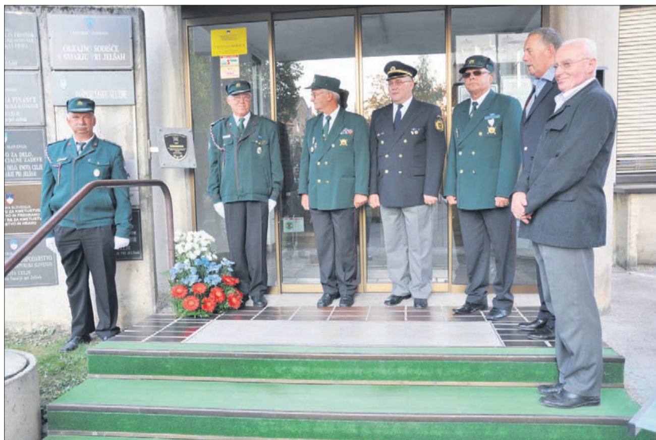
Spomini na čas pred dvema desetletjema. V Šmarju pri Jelšah so odkrili spominsko ploščo.