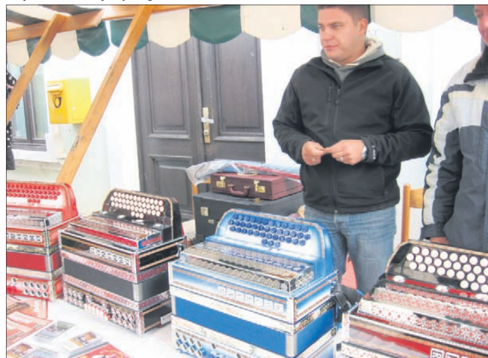
Na njih ne igrajo samo Slakovih viž ... Harmonike, ki jih izdelujejo na Kozjanskem, v Dobju pri Lesičnem.