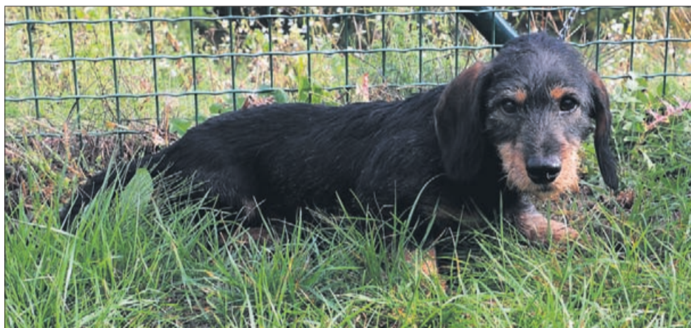
Tudi Jar je pasme resasti jazbečar, star 1 leto.