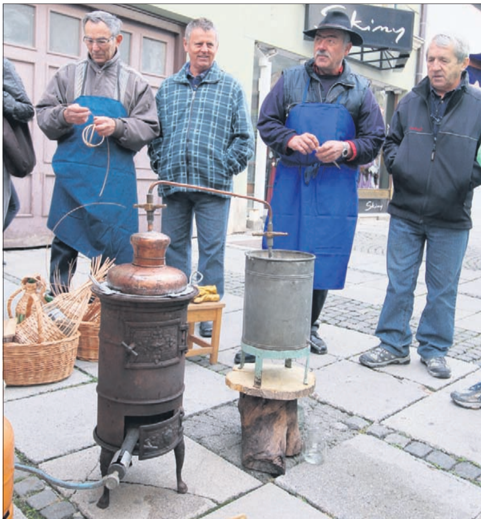
Žganjekuha sredi Celja je pritegnila kar nekaj pozornosti.

Obiskovalce je v središče Celja privabljal tudi bogat spremljevalni program. Najmlajši so na svoj račun prišli v kotičku Tetke jeseni, kjer so se vrstile ustvarjalne delavnice, v katerih so lahko otroci pustili prosto pot domišljiji in kreativnosti ter odkrivali ročne spretnosti. Pravo doživetje je bila tudi vožnja s