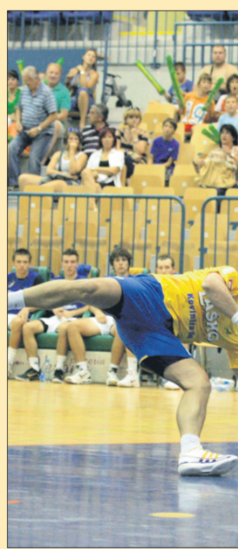
Celjskim rokometnašem je veliko pre Perič zbral 21 obramb ... Na fotogra