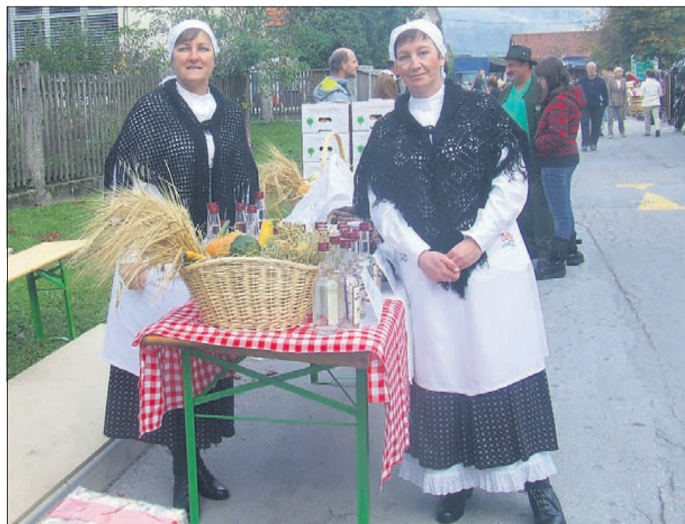
V slogu starih časov se za Lenartov sejem oblečejo tudi domačini, ki prodajajo svoje dobrote.