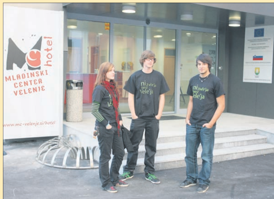
Ob otvoritvi Mladinskega hotela v Velenju

V Sloveniji je mladinski turizem zaradi neenotnega in neorganiziranega nastopa odgovornih na področju mladinskega turizma kljub različnim prizadevanjem še vedno relativno nerazvito področje turistične ponudbe. Svetovna turistična organizacija definira mladinski turizem v ožjem pomenu kot potovanja mladih med 15. in 29. letom (zaradi trenda »podaljševanja mladosti« tudi do 35. leta). Slovenija ima kot križišče mednarodnih