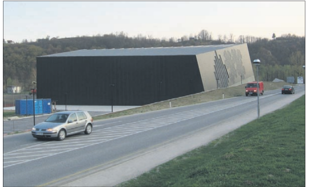
Za arhitekturni dosežek nagrajena pol drugo leto stara večnamenska dvorana v Podčetrtku.