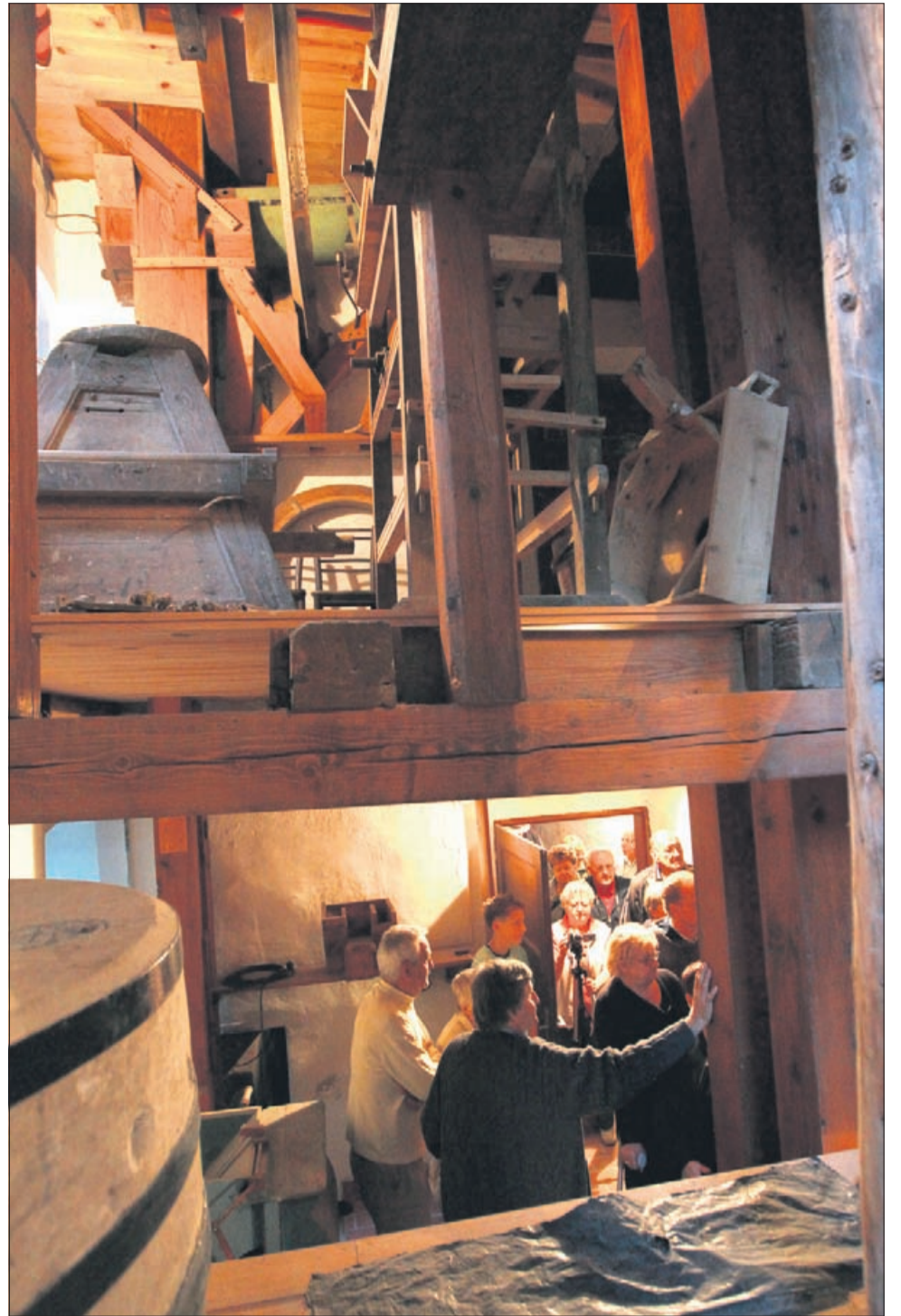
Ferležev mlin je danes obnovljen za muzejske namene. Za njim se skriva stari mlin, v katerem so grajski gospodje mleli že pred šeststo leti.