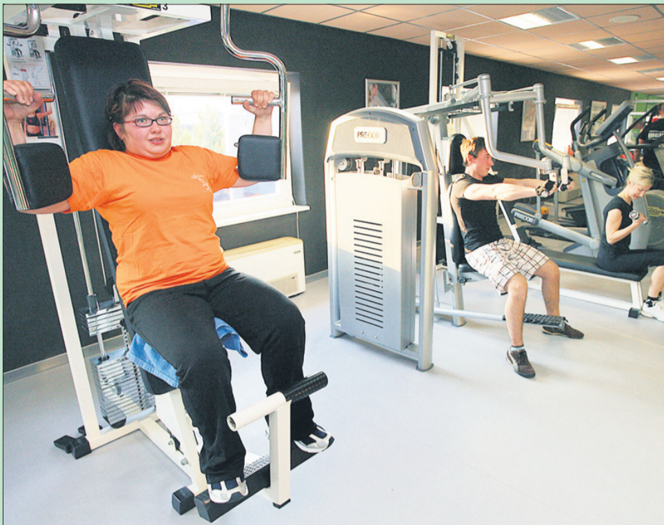
Udeleženci akcije Hujšajmo z NT&RC leta 2010 med vadbo v fitnes centru

Mnogo zapršenih rekreativcev je menilo, da v zaprte prostore fitnesa ne bodo nikoli vstopili ter da njihova dejavnost na prostem zadostuje potrebam po vzdrževanju kondicije, občutku lastnega zadovoljstva in skrbi za zdravje. »Šele ko so poskusili sezono nadgraditi z vadbo v fitnesu, so uvideli, kako veliko lažje je premagovati napore in uživati v športu ter izbrani aktivnosti.« Vse več ljudi tudi v poletnem času vsaj dvakrat na teden zato obišče fitnes. Vadba tam je priporočljiva tudi za rehabilitacijo po poškodbah, kjer je še zlasti pomembno sodelovanje med fizioterapevtom in inštruktorjem fitnesa.