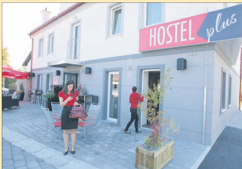
V novem mladinskem hotelu v Petrovčah je v petih sobah na voljo 15 ležišč, vsaka soba ima svojo kopalnico. Na voljo so tudi pralnica in sušilnica ter internet.