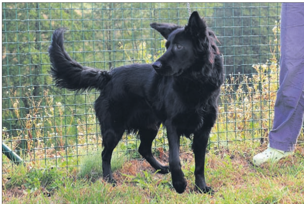
Zax je star 10 mesecev, je mešanec srednje rasti.