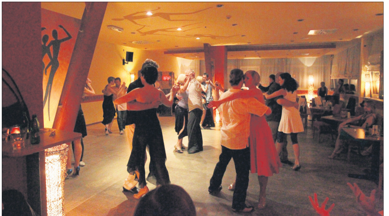
Tango festival so v Celju pripravili drugič, odzivi so bili odlični. Med plesalci so bili Italijani, Avstrijci, Nemci, Srbi, Hrvati, pri organizaciji so pomagali Grk, Turek in Američanka. Prišla sta celo dva Avstralca. Tudi Slovenci, se razume, le Celjanom to še ni blizu.