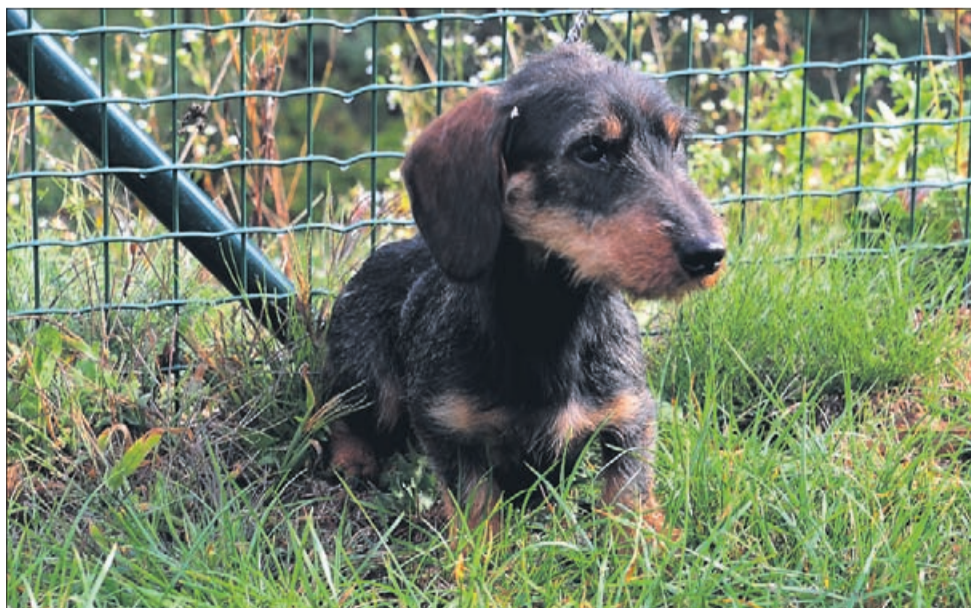
Ron je resasti jazbečar. Star je 1 leto, manjše rasti, prijazen in igriv.