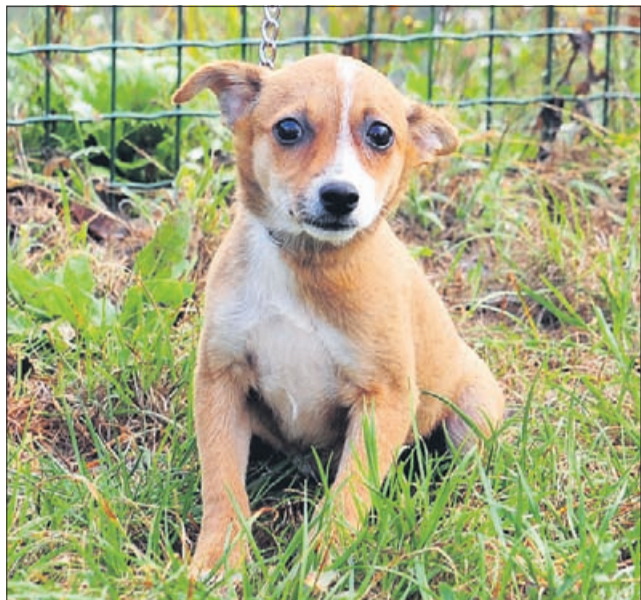
Aura je sterilizirana mešanica, stara 4 mesece.

V Zonzaniju vas čakajo štirinožci na fotografijah, ki iščejo skrbnega gospodarja.