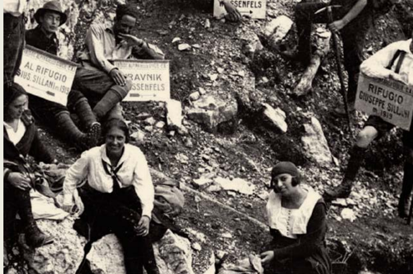
Italijanska CAI se je takoj po zasedbi lotila spodbujanja planinstva v gorah zasedenih Julijskih Alp. V to je sodilo tudi preimenovanje obstoječih avstrijskih in slovenskih koč. Na posnetku skupina, ki je leta 1922 nesla označevalne table za avstrijsko kočo na Mangartskem sedlu - ta se je med vojnama preimenovala v rifugio Giuseppe Sillani.

snežnih teptalcev kraljevala št. 32, Gorenji Vrsnik nad Žirmi je imel mejnik št. 40, ob robu gozda nad Uncem je stala št. 50, zadnja dva na naših tleh, št. 60 in 61, pa najdemo vsa zaraščena na naši sedanji južni meji, sredi gozdov JV od Snežnika.