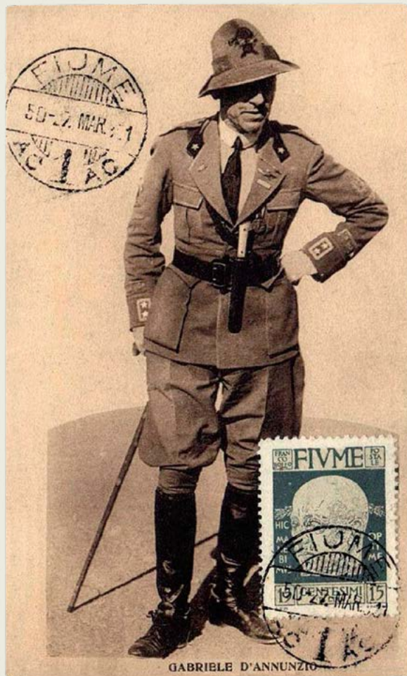
Gabriele D'Annunzio na razglednici, poslani z Reke leta 1921. Zaradi zaslug pri zasedbi Reke je pozneje dobil tudi častni naziv Principe di Montenevoso (Princ Snežnika). Snežnik je zaradi taktičnih potez lastnika gozdov in Mussolinija skoraj v celoti pripadel Italiji.

Po petnajstih mesecih zasedbe in sprenevedanja italijanske vlade, ki je zaradi lepšega posredovala z redno vojsko, so se legionarji umaknili – Reka pa je ostala italijanska in s celotnim zaledjem pristala na zahodni strani rapalske meje. Kraj Ronke, kjer je tržaško