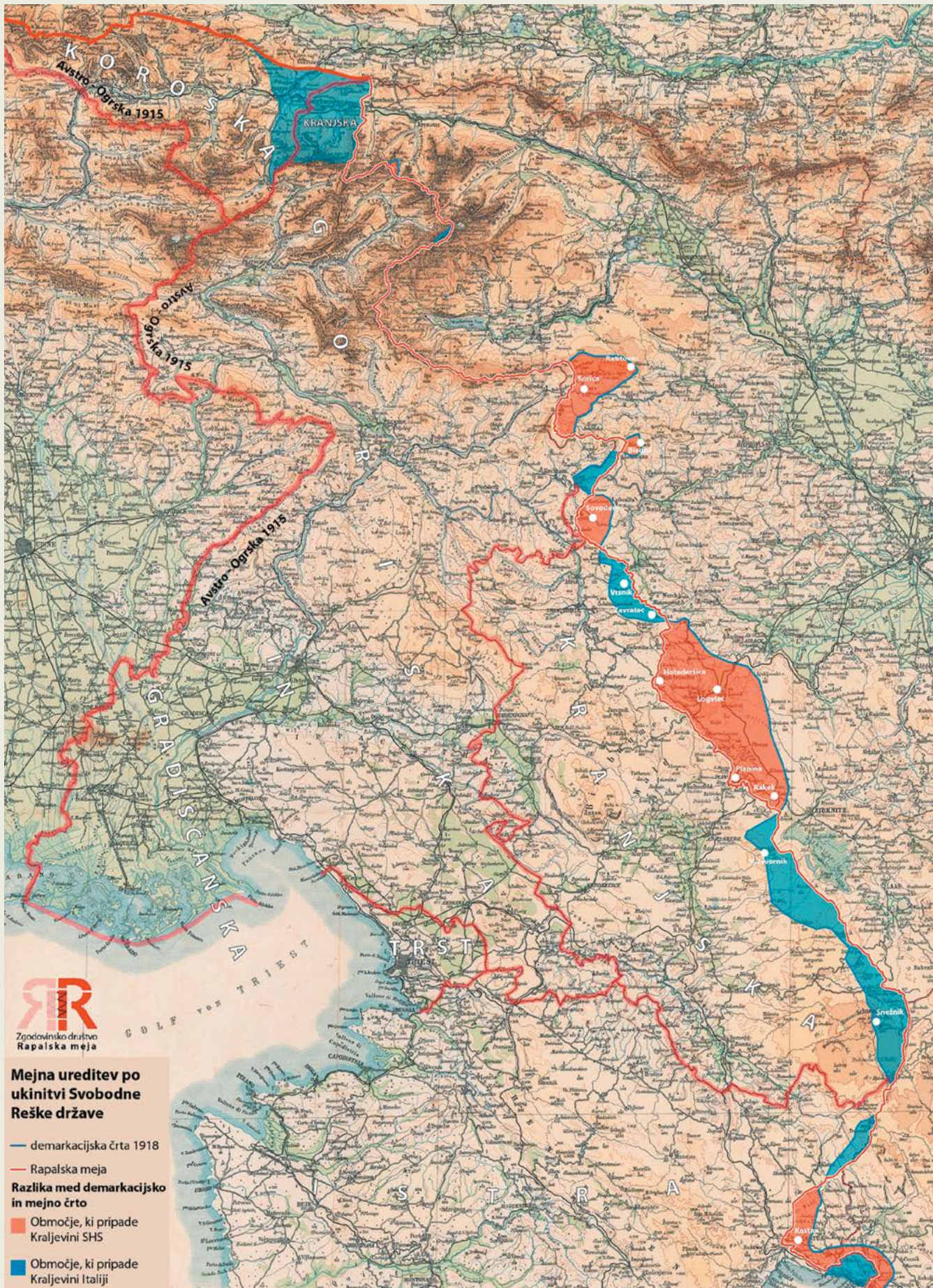
Zemljevid prikazuje popravke demarkacijske črte med kraljevinama, ki so stopili v veljavo s podpisom Rapalske pogodbe. Kar je obarvano rdeče, je dobila kraljevina Jugoslavija, modro pa Italija. Jugoslavija je med drugim dobila Sorico, Blegoš, Sovodenj, Logatec in Rakek, izgubila pa Vrsnik, V. Javornik in Snežnik. Zemljevid: Grega Žorž