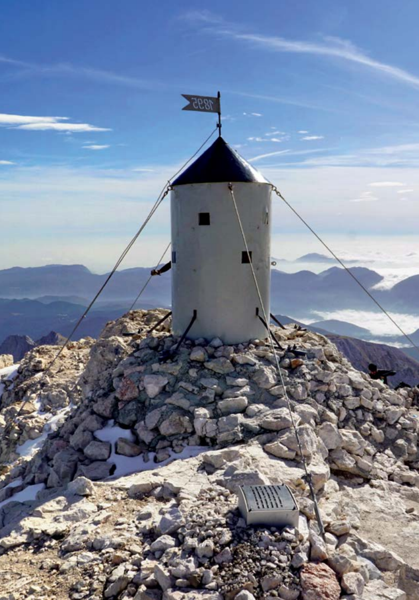
Po razmejitvi na Triglavu je Aljažev stolp ostal na jugoslovanski strani meje, od mejnika je bil oddaljen 2,55 m. Mejnik št. 10 je v prepad potisnila partizanska patrulja avgusta 1944. Od jeseni 2019 je mesto mejnika obeleženo s spominsko ploščo, s čimer je bil tudi končan projekt temeljite obnove stolpa.

bilo treba še vedno držati pravila, da je v petkilometrskem pasu dovoljeno gibanje le s člansko izkaznico, potrjeno na notranji upravi.