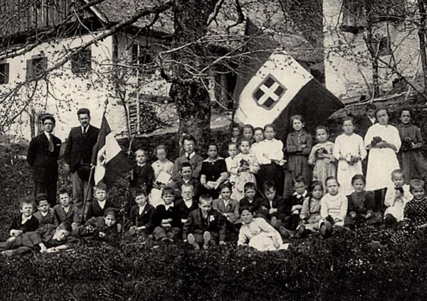
Otroci in učitelji pred osnovno šolo pri Gorenjih Novakih nad Cerknim leta 1925. Posledice Gentilejeve šolske reforme, po kateri je italijanska vlada določila, da sme biti učni jezik v šolah izključno italijanski, so očitne. Razredno fotografijo so morali »okrasiti« kar z dvema italijanskima zastavama.