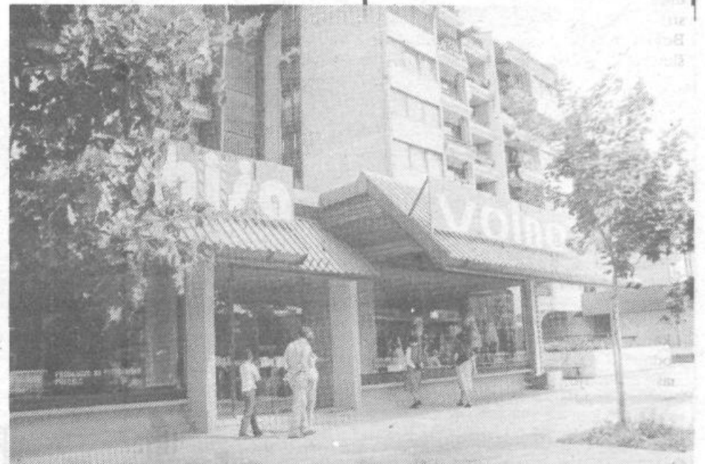
Pročelje tekstilne hiše Volna v Trnovem