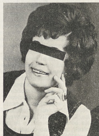
Marca 1973: 62,5 kg

Ta primer kaže, kako važno je usklajeno teamsko delo v ustanovi, kot je zdravi-