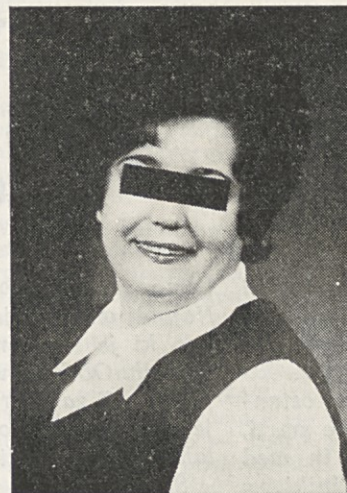
Maja 1972: 86 kg