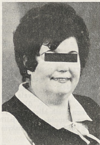
Novembra 1971: 125 kg

ka za reden nadzor in priporočil preglede, s katerimi bi na kliniki ugotovili morebitne nepravilnosti v delovanju žlez z notranjim izločanjem (ščitnica, jajčniki, hipofiza, trebušna slinavka, skoraj nadledvične žleze). Dobili smo sporočilo, da so ob pre-